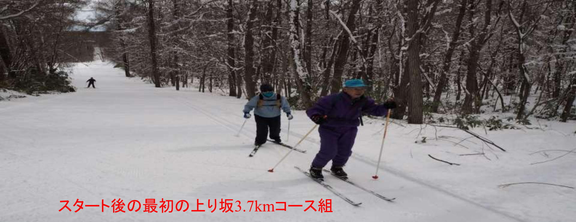
スタート後の最初の上り坂3.7kmコース組