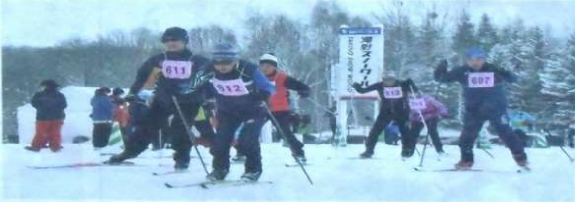
園宮滝野すずらん丘陵公園で開かれた道民・札幌市民歩くスキーの集い。今回は50回目の節目となる2024年

民のウインタースポーツ 足。設立当時は会員288人の関心が高まったこと 8人、多いときは千人以上を機に1974年に発 上の会員がいた。冬の歩