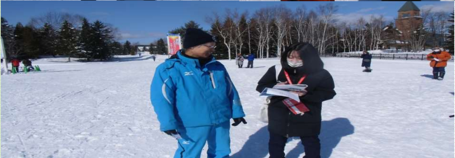
開催前に北海道新聞の取材受ける各staff