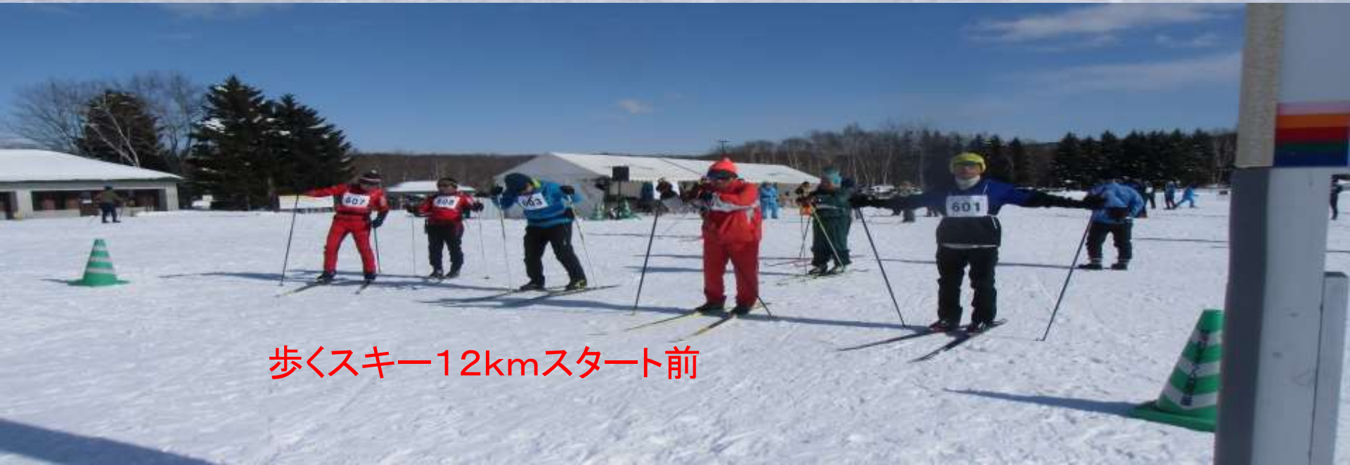
歩くスキー12kmスタート前