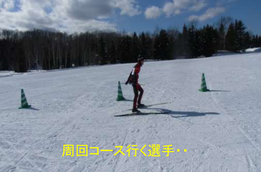
周回コース行く選手..