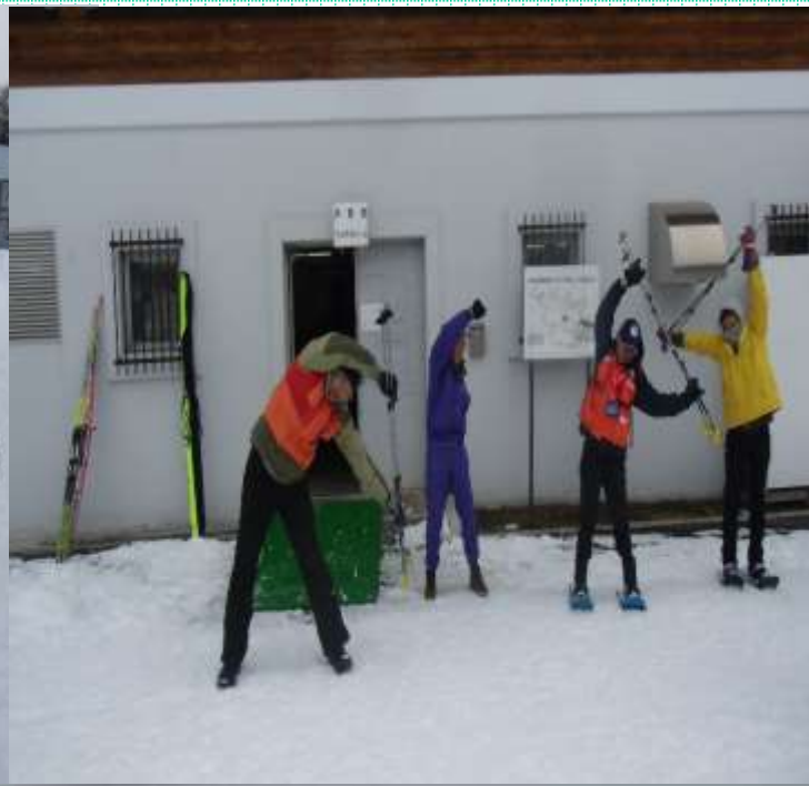
念入りな準備体操