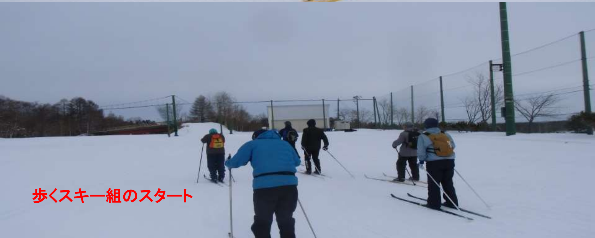
歩くスキー組のスタート