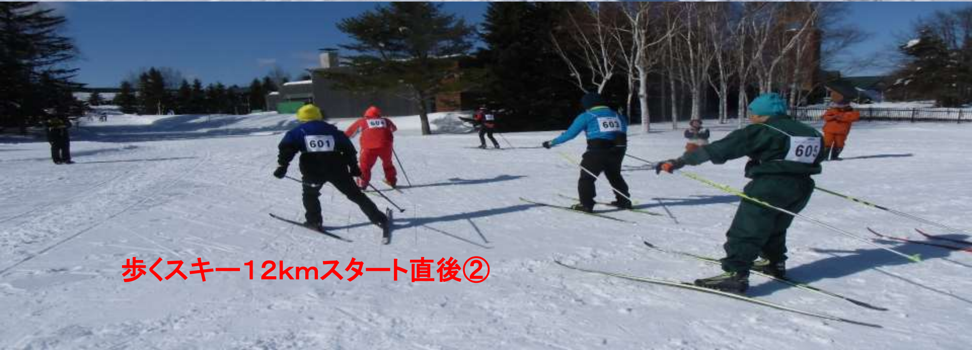
歩くスキー12kmスタート直後②