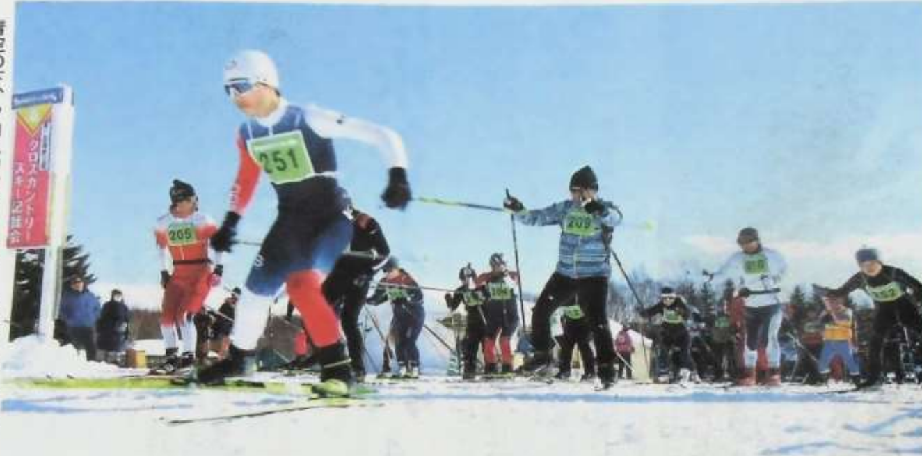
青空の下、クロスカントリースキーで汗を流す参加者

クロスカントリースキーを楽しむ「第50回記念 道民・札幌市民歩くスキーの集い」が24日、札幌市南区の滝野すずらん丘陵公園で開かれた。晴天の下、愛好者らが自然豊かな園内のコースを走り抜けた。