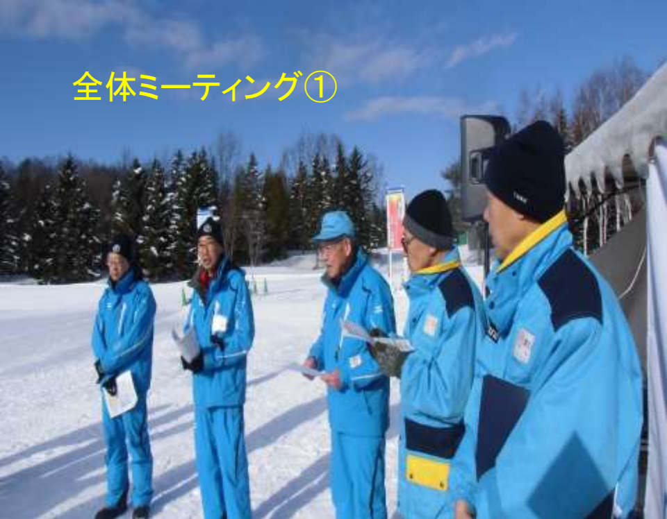
全体ミーティング①