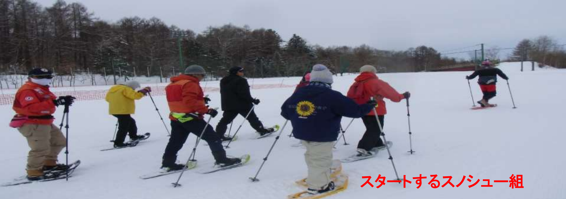
スタートするスノシュー組