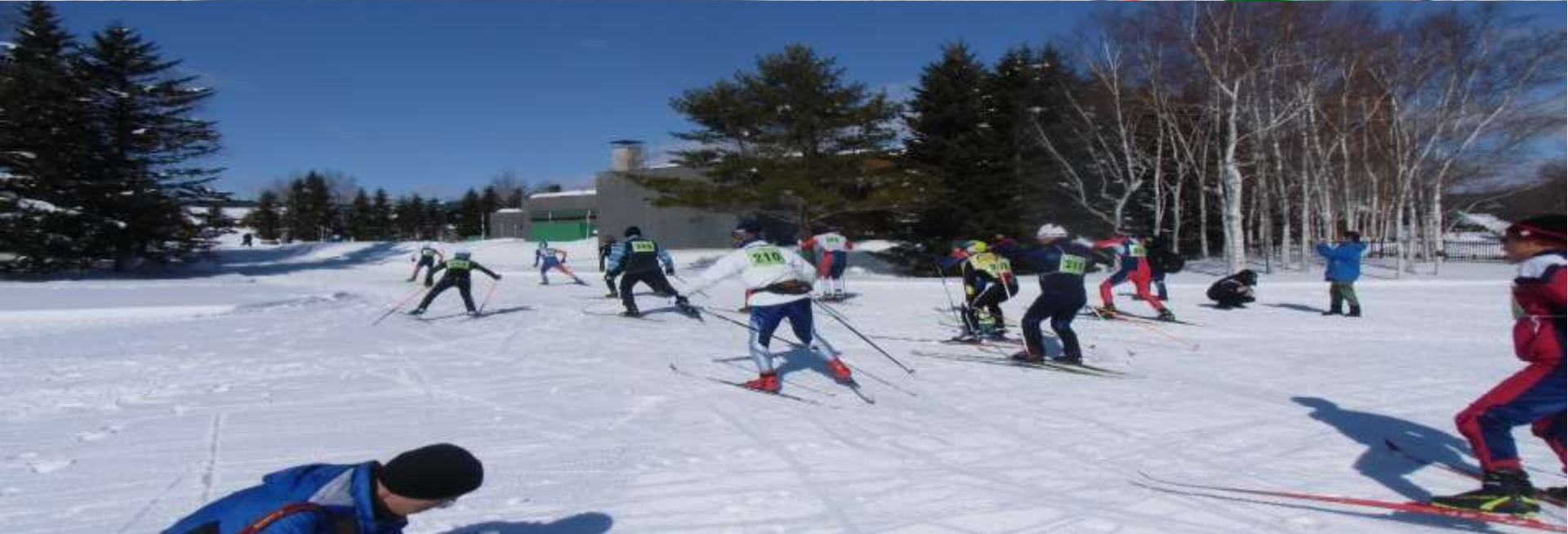
12km記録会スタート時・スタート後