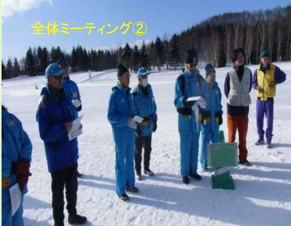
全体ミーティング②