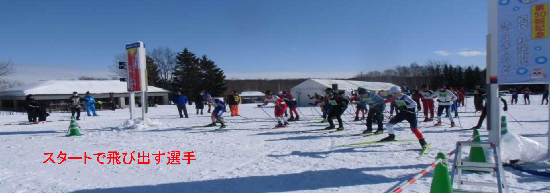
スタートで飛び出す選手