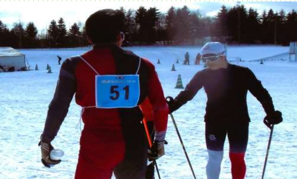
出発前のスキー・雪質を確認する各選手(下)