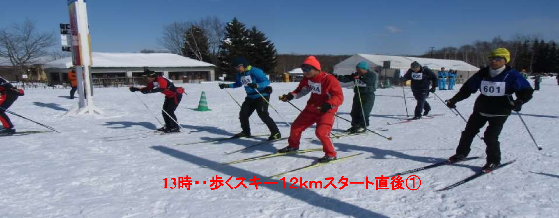
13時・・・歩くスキー12kmスタート直後①