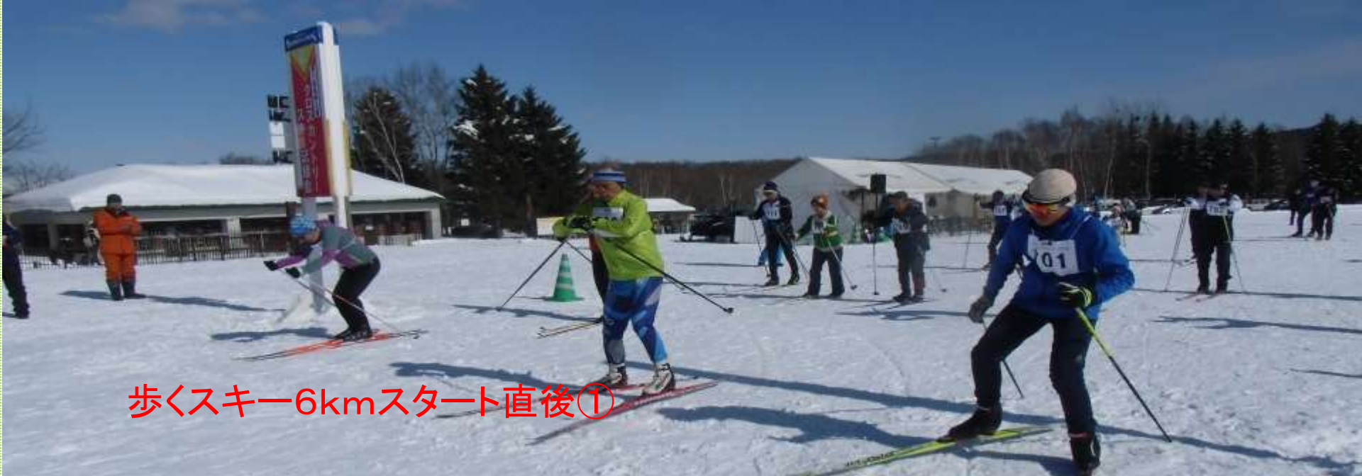
歩くスキー6kmスタート直後①