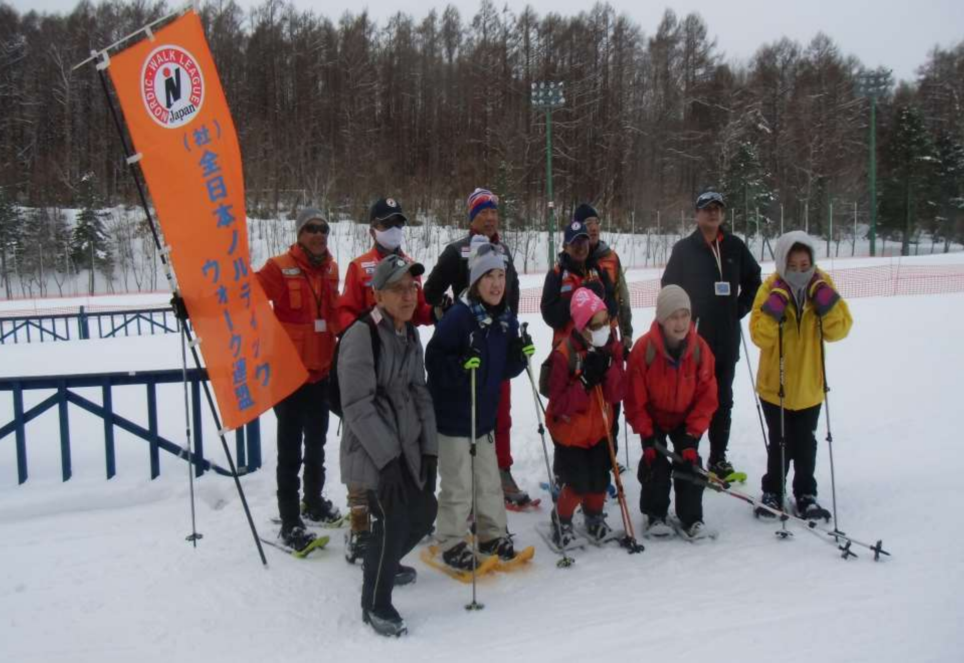
出発前のスノシュー組記念写真