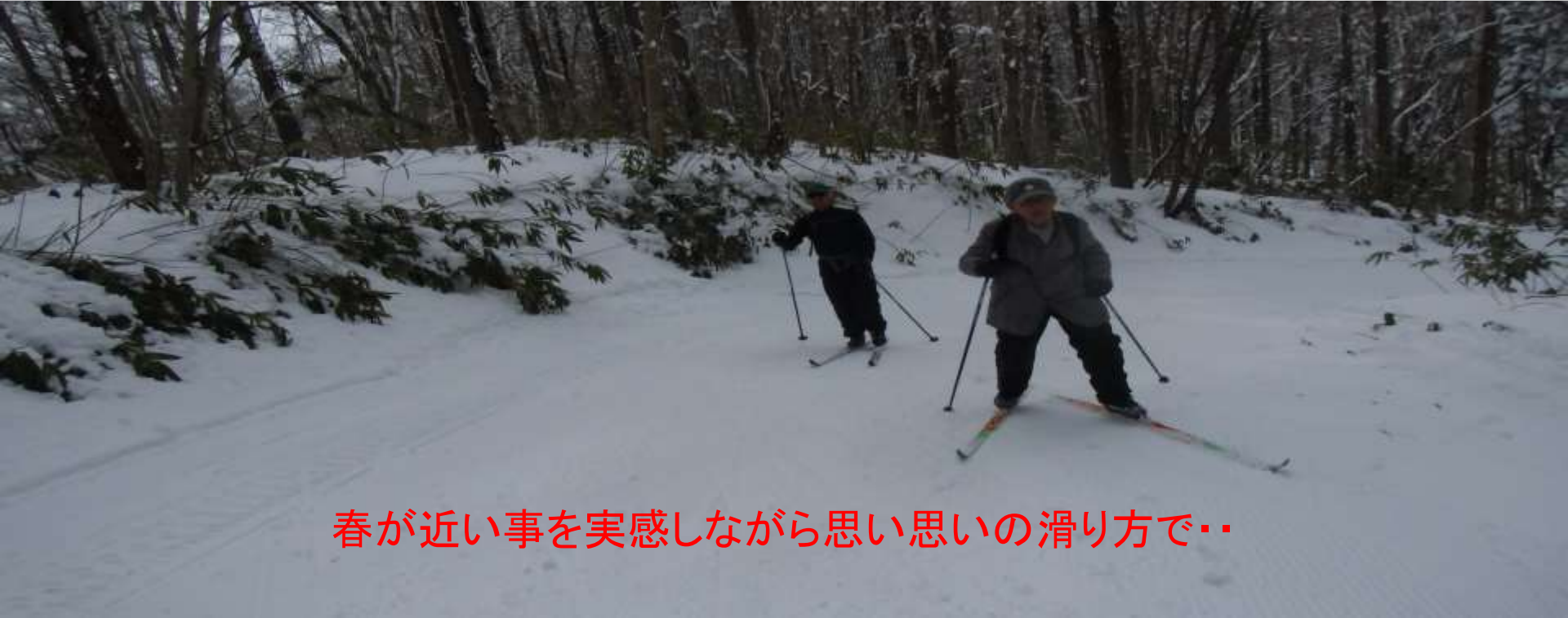
春が近い事を実感しながら思い思いの滑り方で..