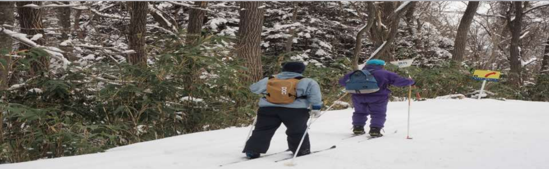
その後順調に進んでいます・・・3.7kmコース