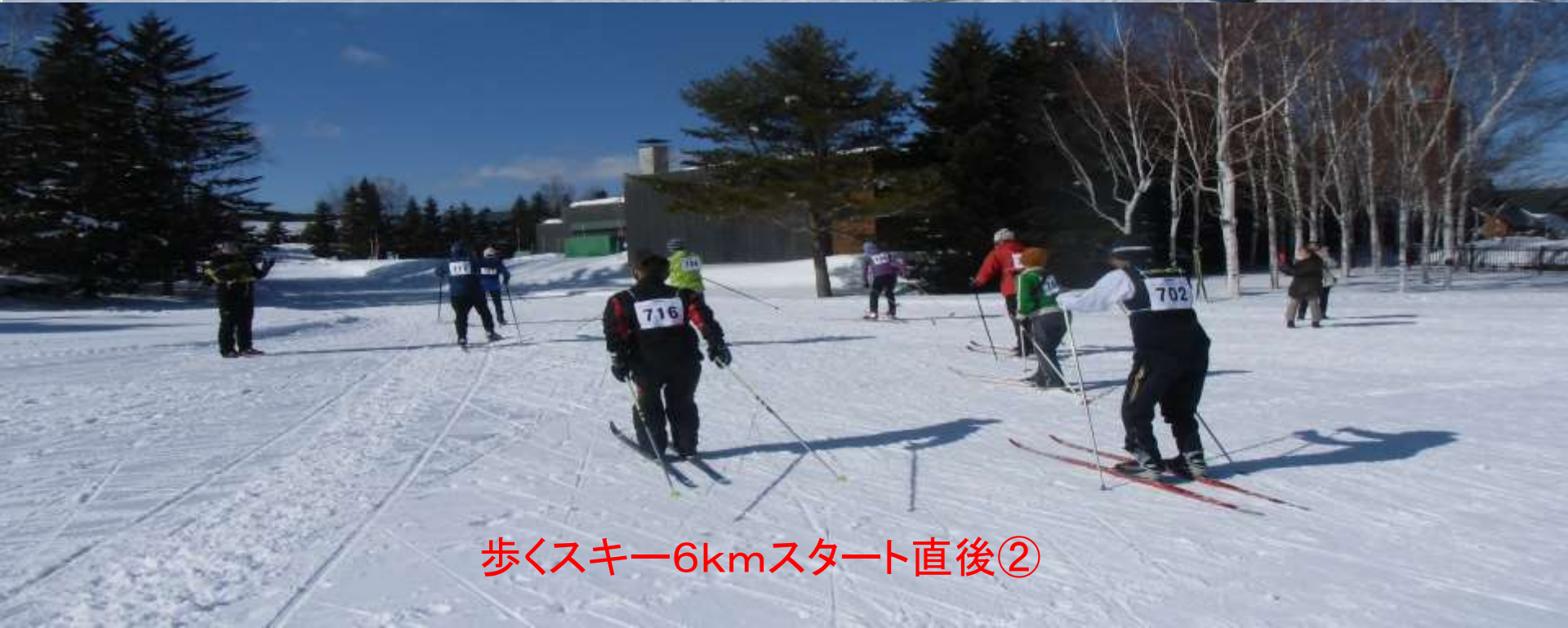
歩くスキー6kmスタート直後②