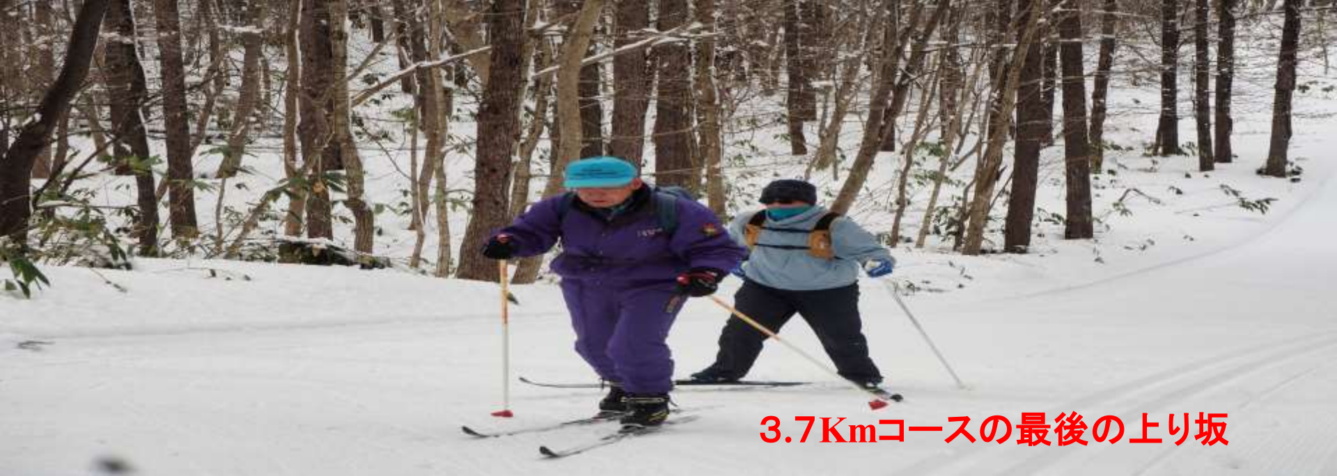
3.7Kmコースの最後の上り坂