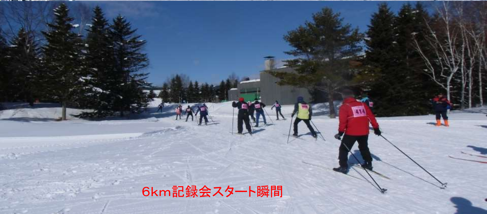
6km記録会スタート瞬間