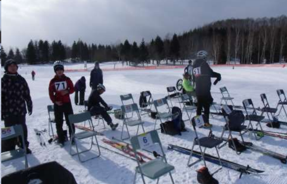
大会前・・・会場準備も出来ました