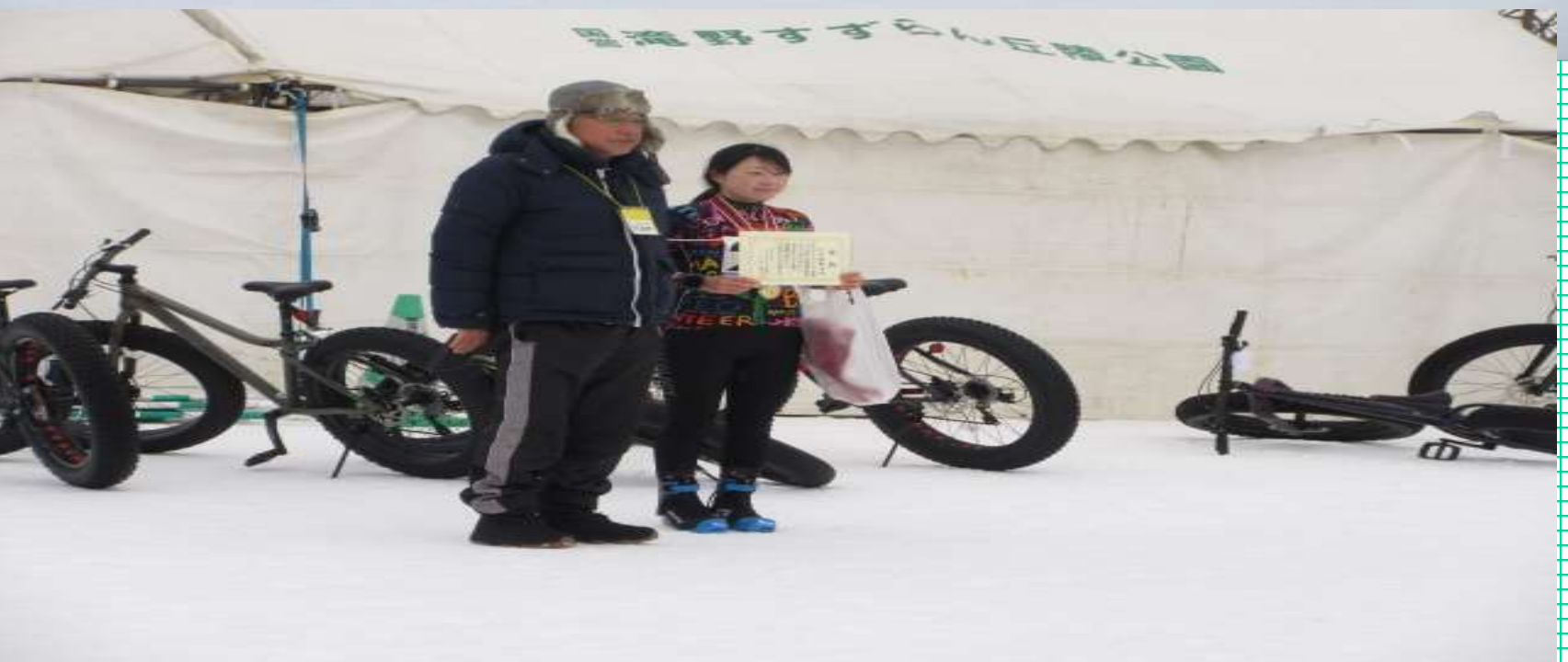
Aコー入女子入賞者授与式