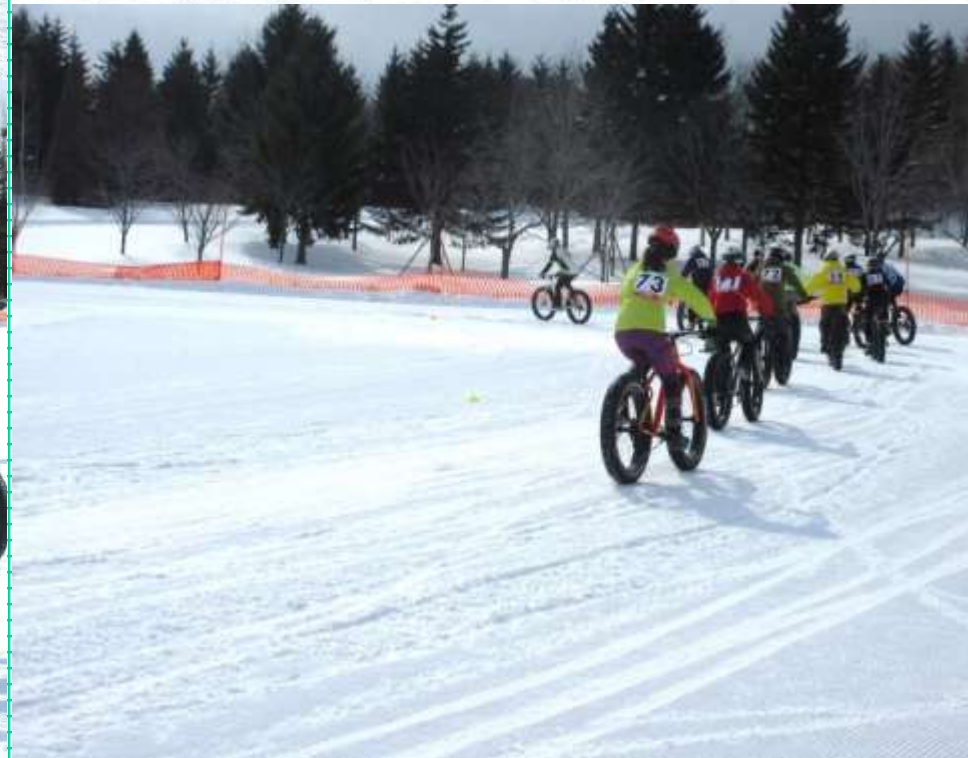
Bコース女子3名、男子10名のバイクスタート前とスタート時②