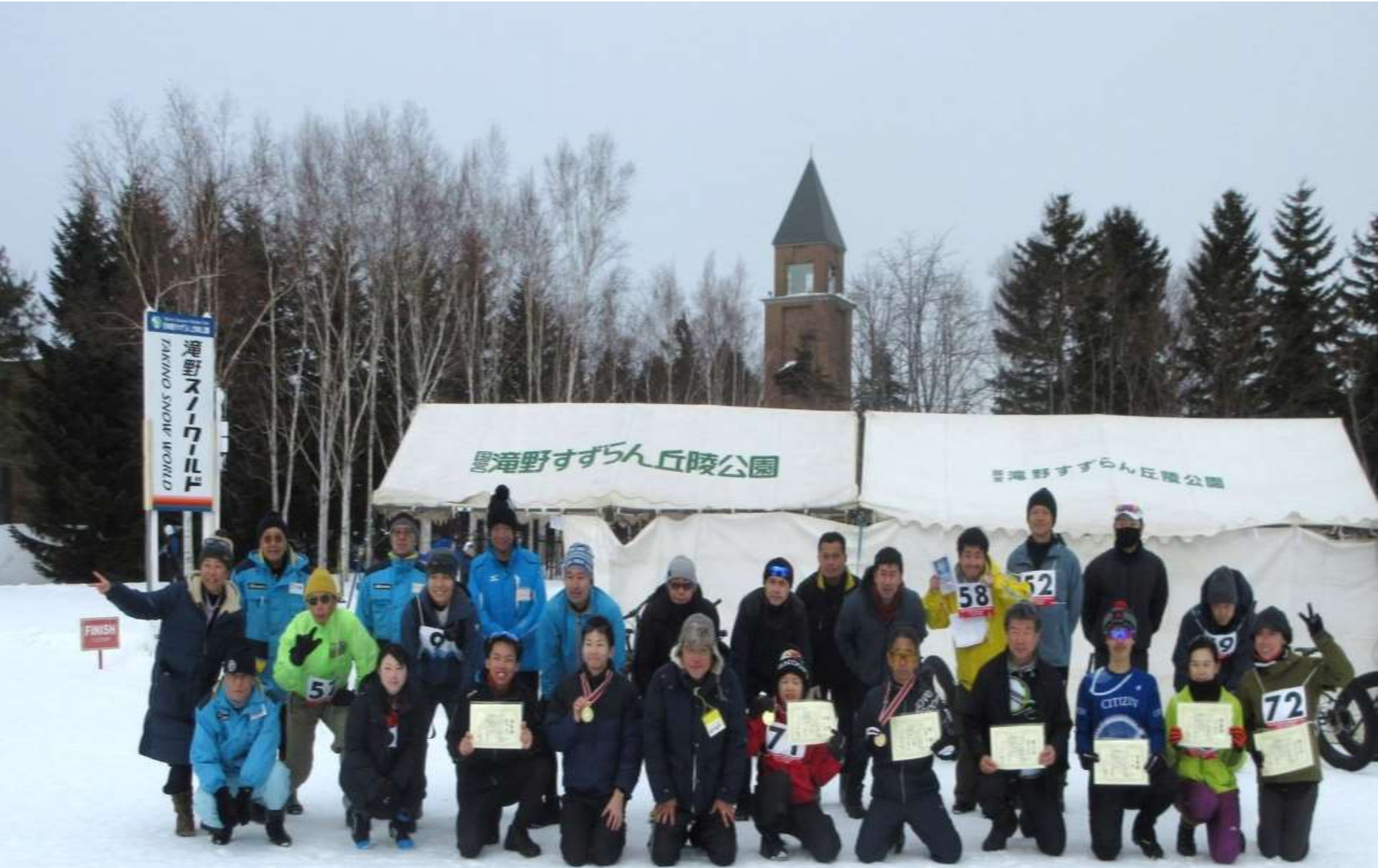
参加者全員で記念写真