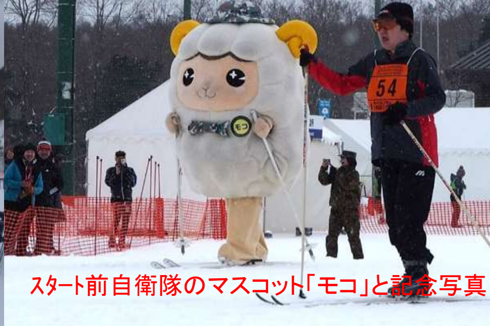
スタート前自衛隊のマスコット「モコ」と記念写真