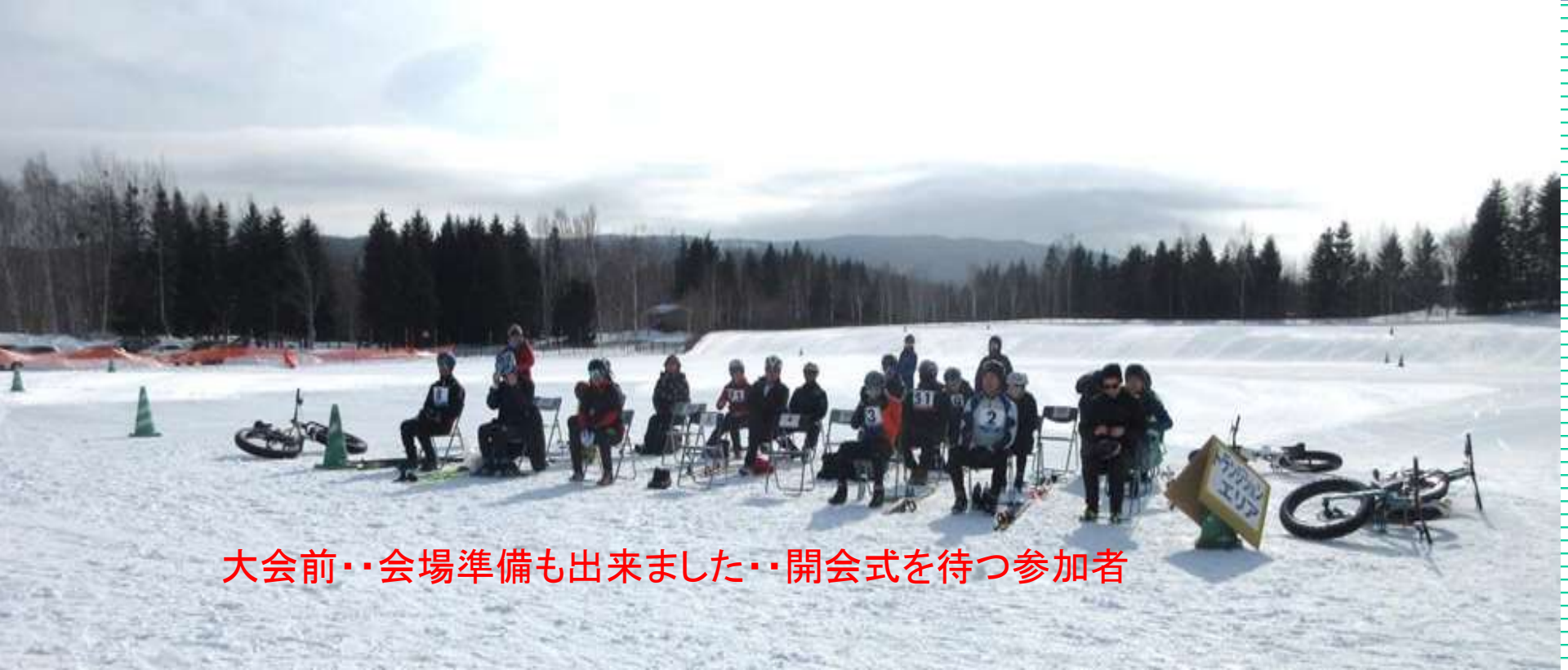
大会前・会場準備も出来ました・開会式を待つ参加者