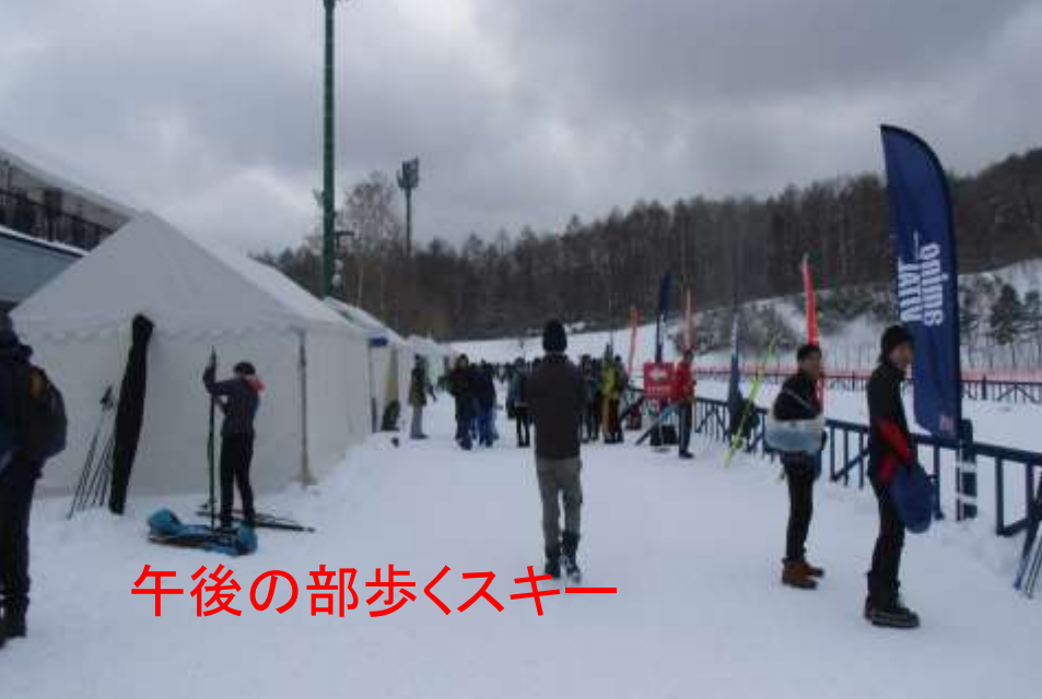
午後の部歩くスキー