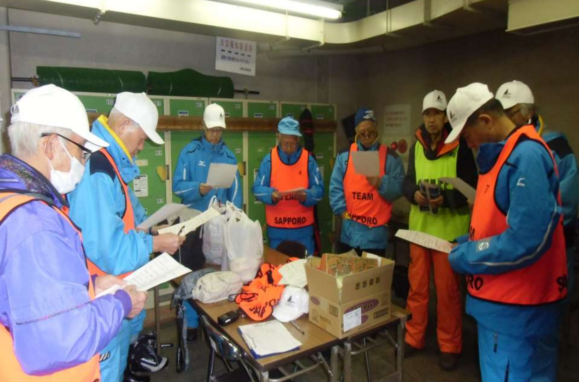
大会前の確認ミーティング7時30分～