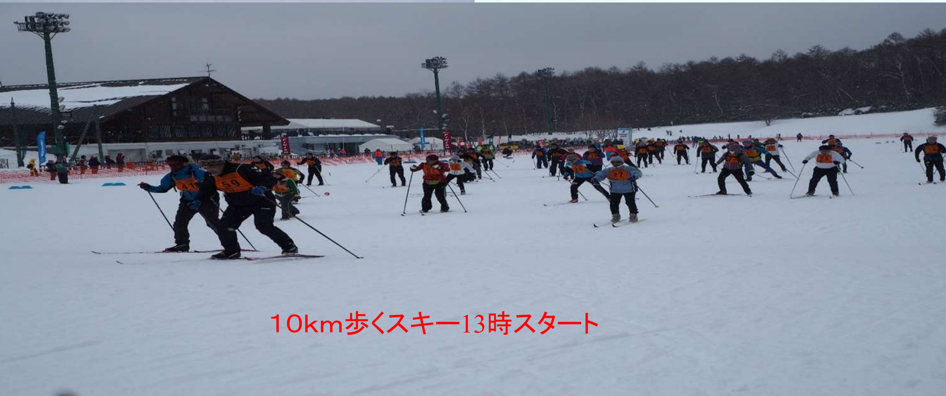
10km歩くスキー13時スタート