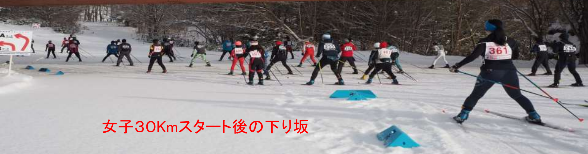
女子30Kmスタート後の下り坂