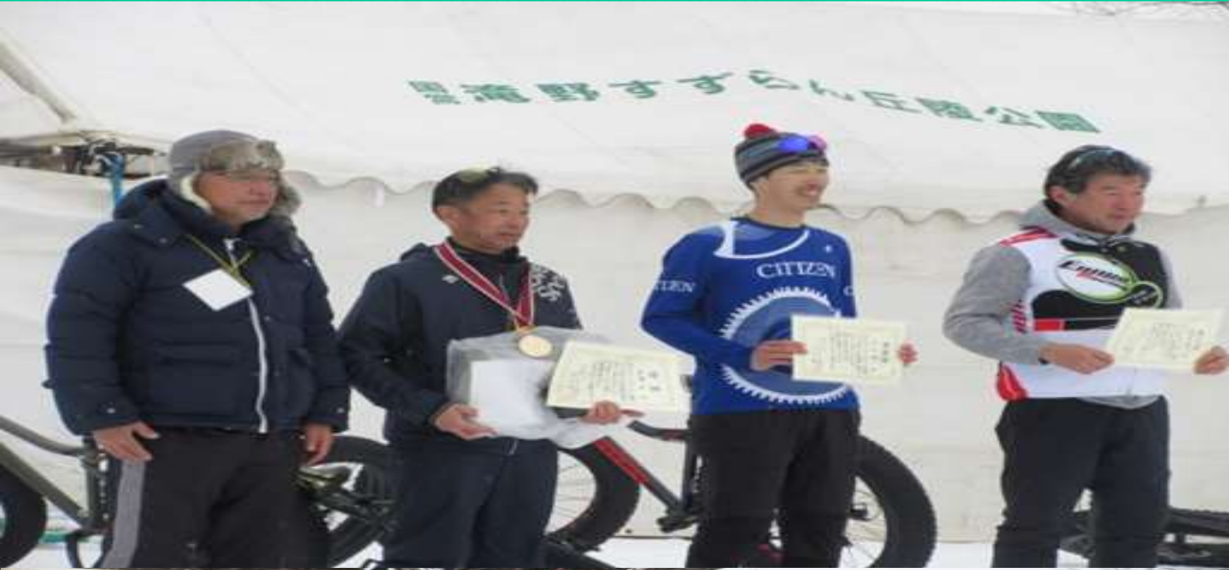
Bコース男子入賞者授与式