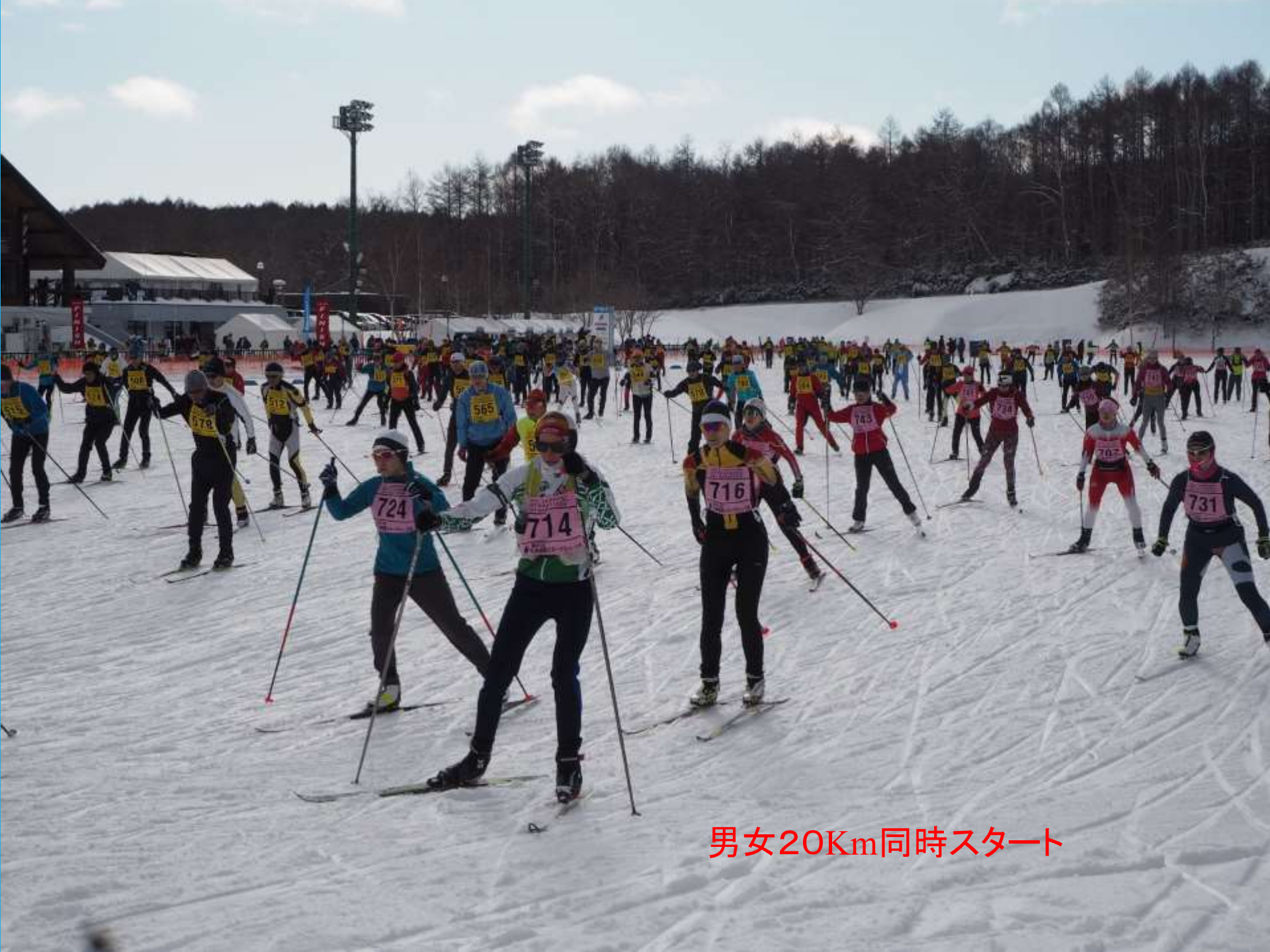
男女20Km同時スタート