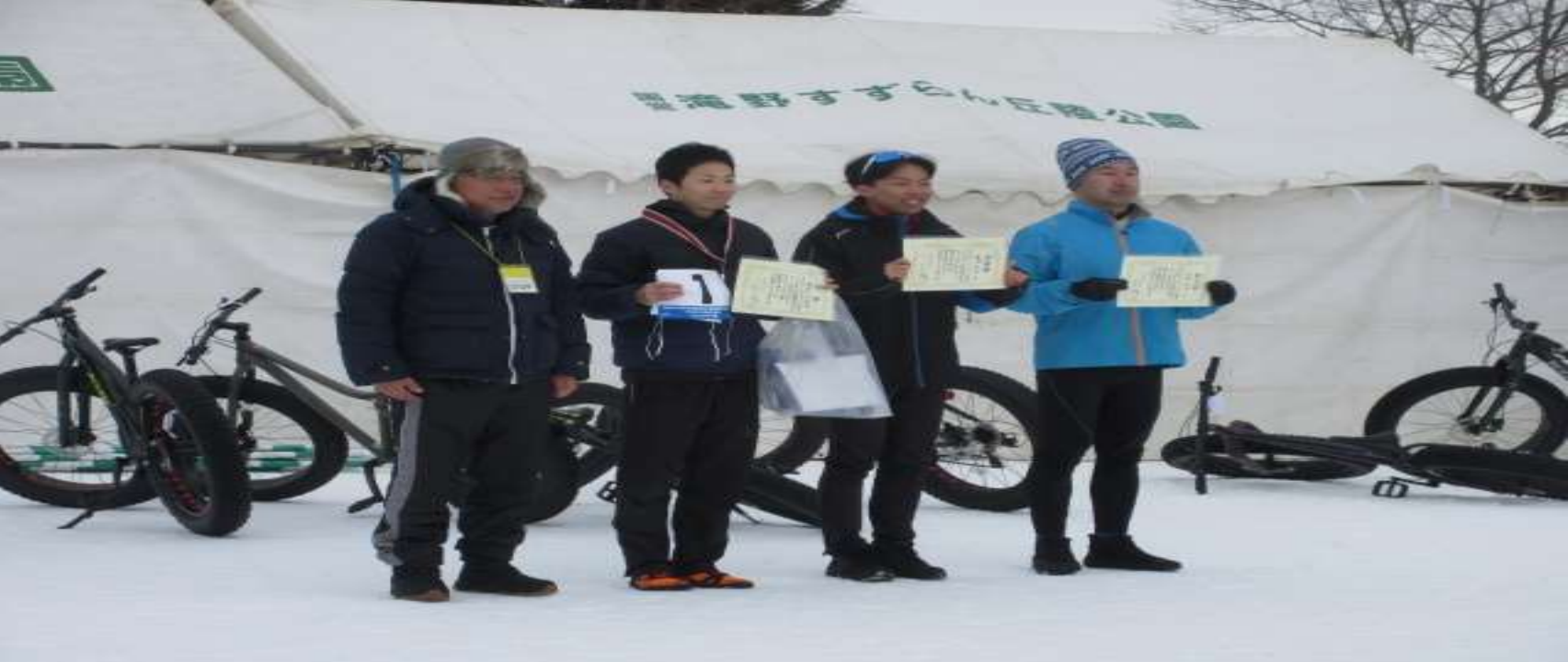
Aコー入男子入賞者授与式