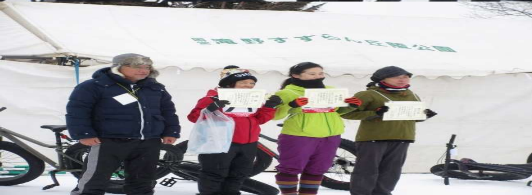
Bコース女子入賞者授与式