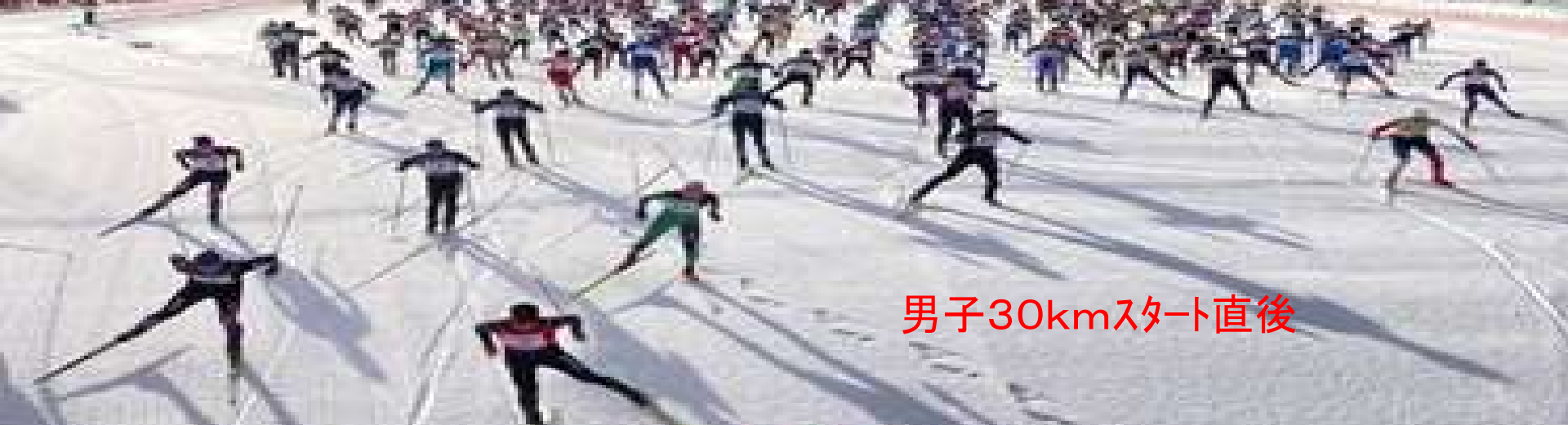
男子30kmスタート直後