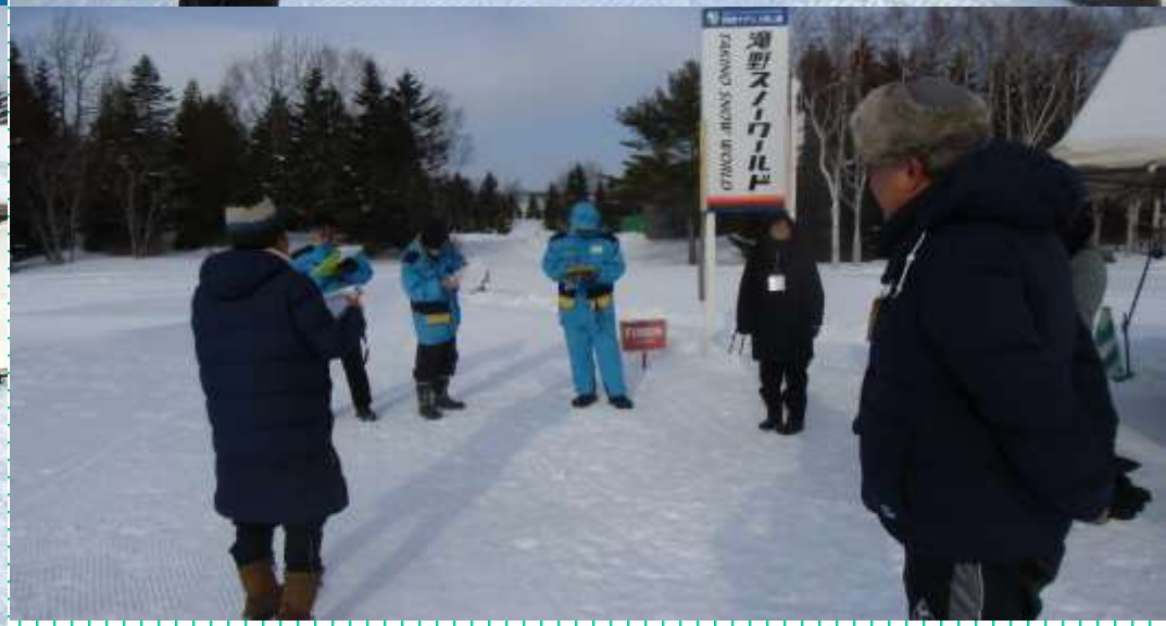
8:20・・スタッフ全体ミーティング