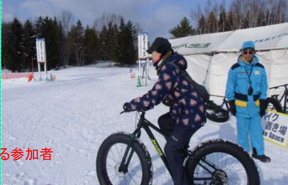
大会前バイク試乗する参加者