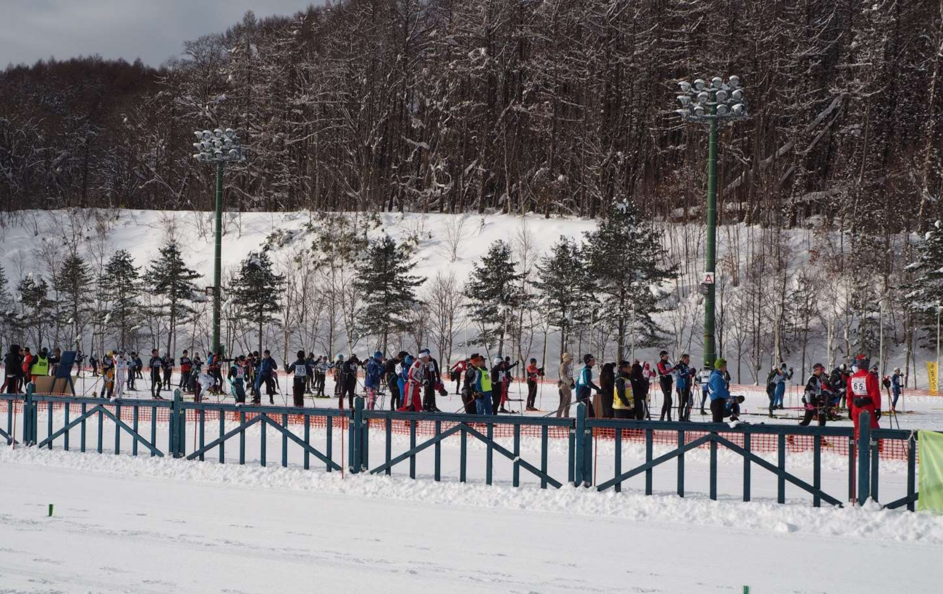
午前の部スキーマラソン …スタート前の参加者