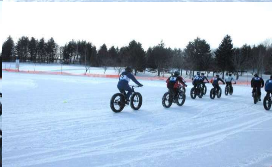
Aコース女子1名、男子9名のバイクスタート前とスタート時①