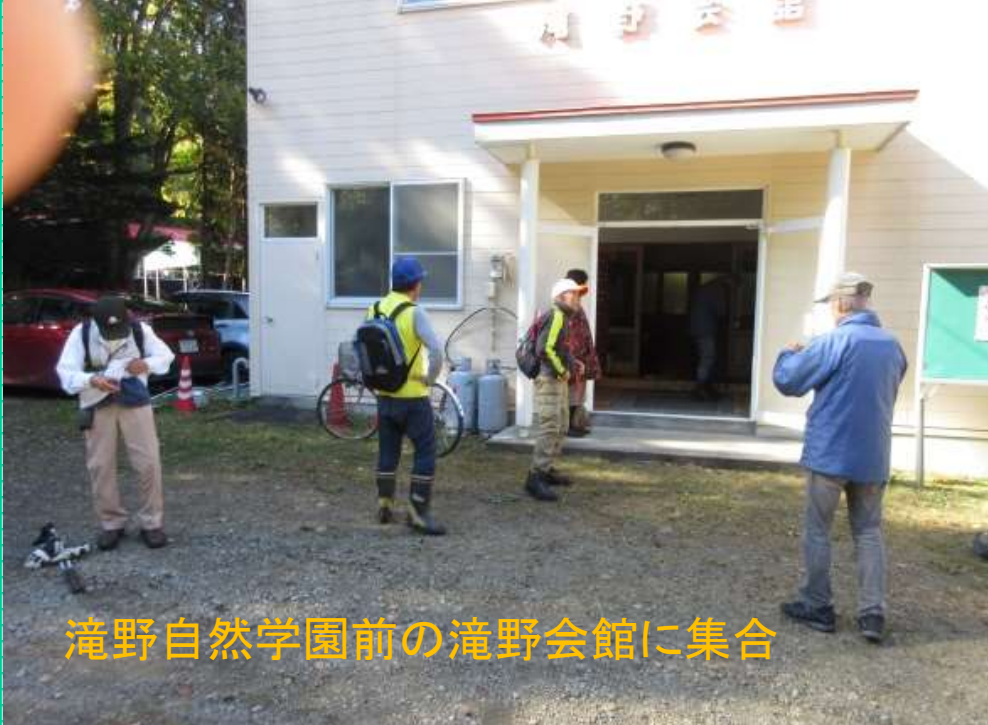
滝野自然学園前の滝野会館に集合