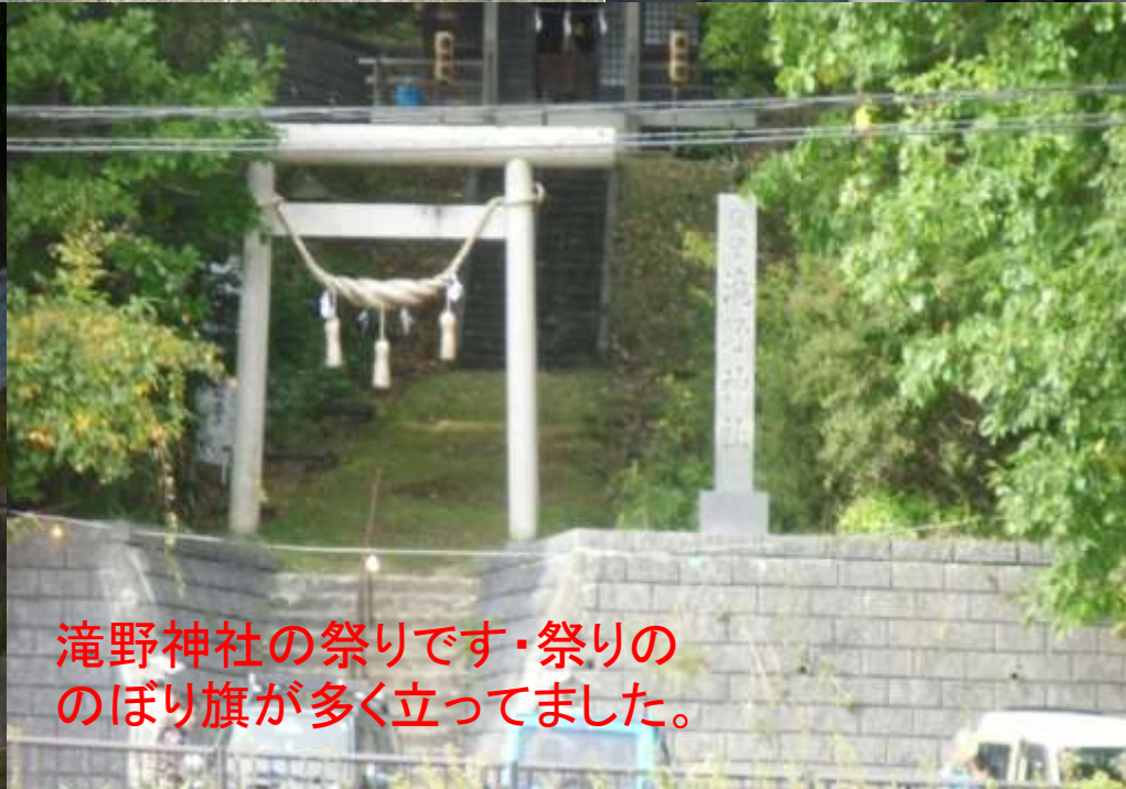
滝野神社の祭りです・祭りの のぼり旗が多く立ってました。

今日は滝野神社のお祭りです。昭和の時代は賑やかでしたが、当地区は調整区域の為住宅建設不可・人口は減るのみでお祭りも・高齢化で縮小寂しい限りと話す管理人