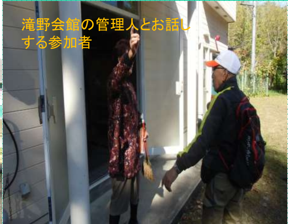
滝野会館の管理人とお話 する参加者