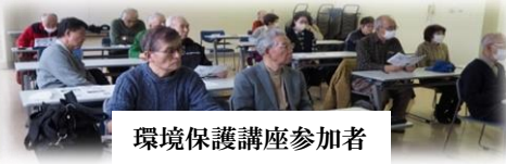
環境保護講座参加者

※行事の詳細はホームページ ( https://arukuski-h.sakura.ne.jp ) 内の協会ニュースをご覧ください。