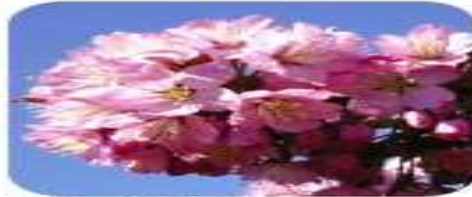
クナシリヨウコウ