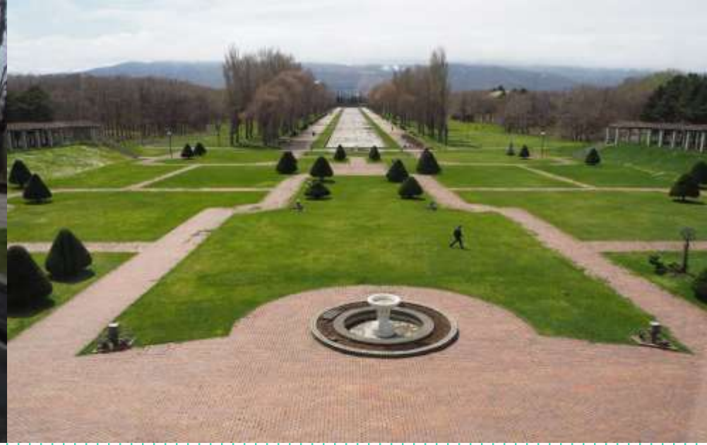
展望台から見た洋風庭園・カナルを含む大パノラマ