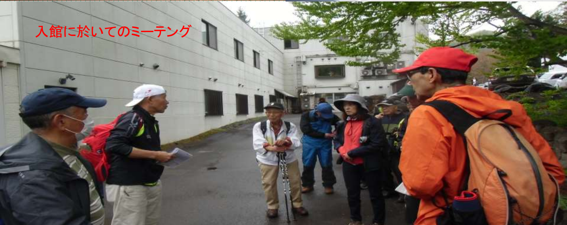
入館に於いてのミーティング