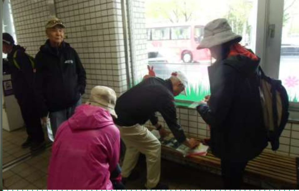
9時過ぎ地下鉄真駒内駅・・・天気が心配