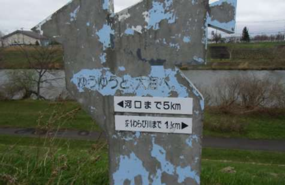
最後の新川に入りました。 「ゆうゆうと大海へ」標識・・・石狩湾迄5km