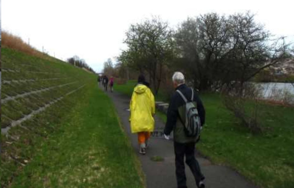
新川堤防下を歩く・・・