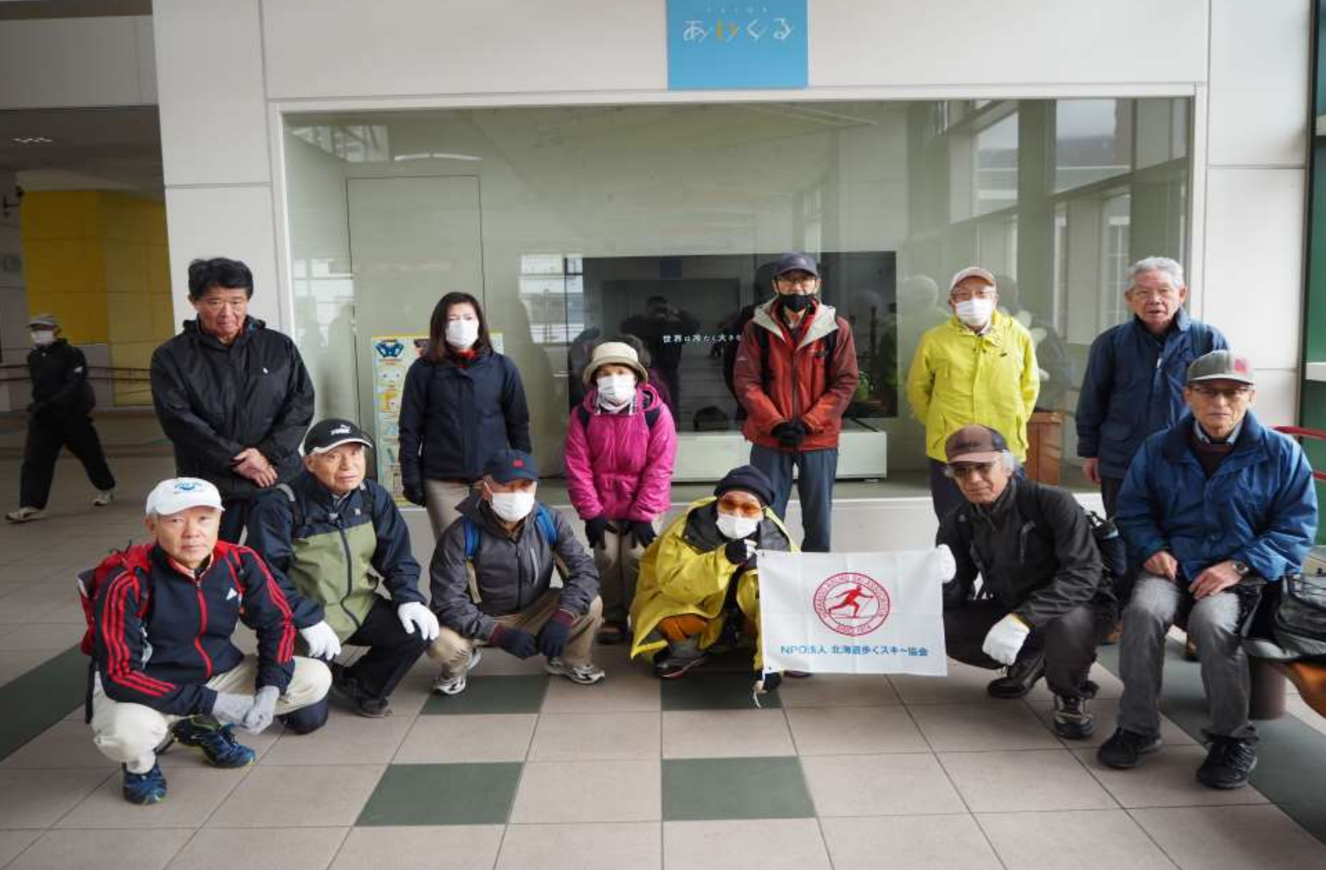
JR手稲駅コンコース広場・出発前の集合記念写真 参加者13名