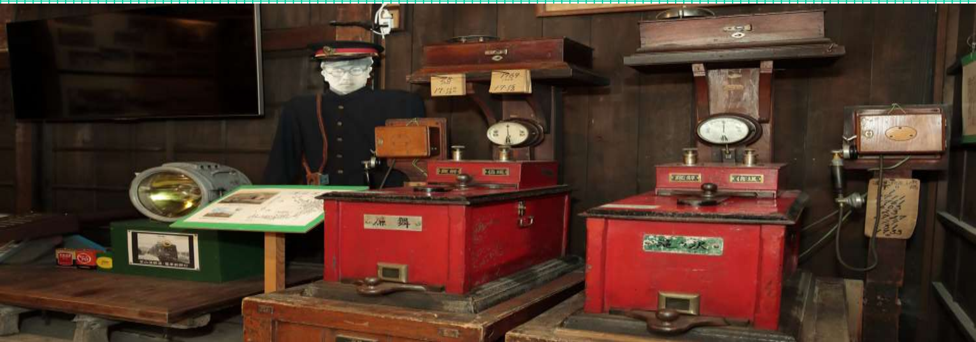
定山溪鉄道で使われていたタブレット閉塞機(下)