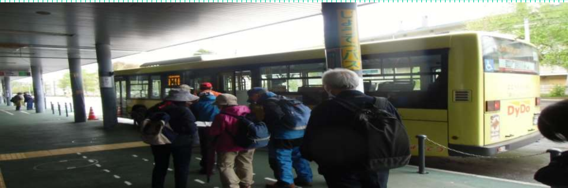
9時51分発バスに乗車する(下)