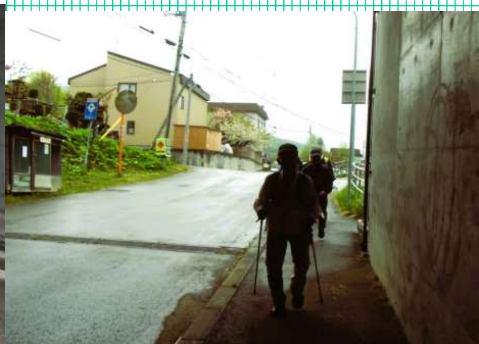
足取り速く・・・