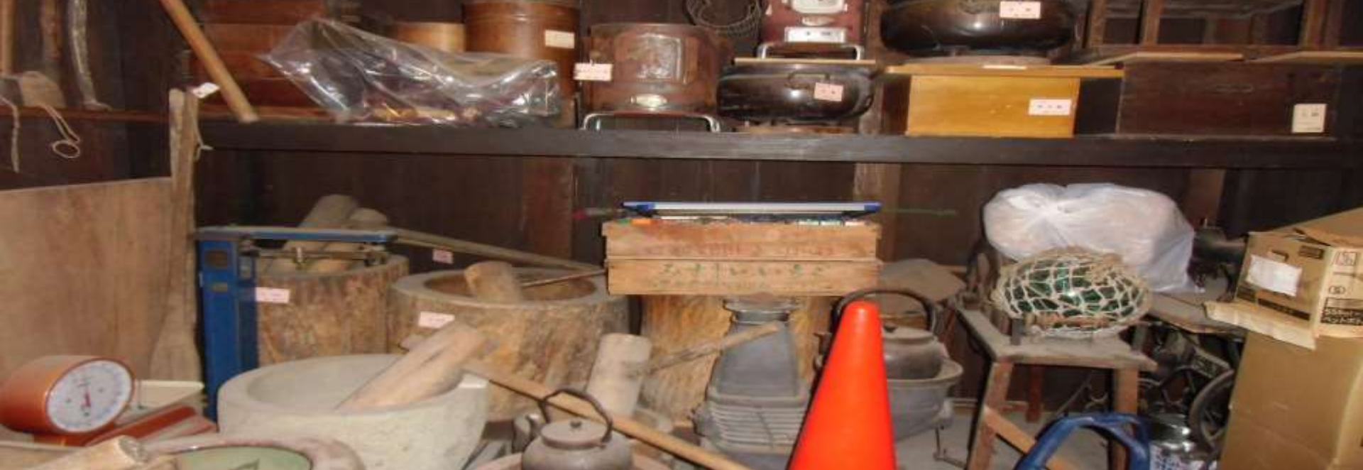
当時の生活用品等の展示品(上)