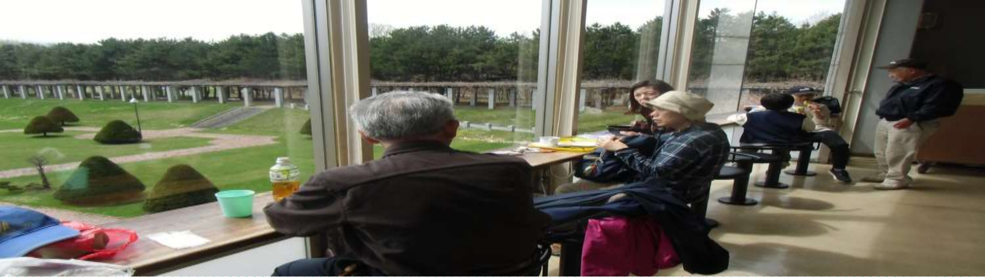
展望ラウンジで景観を楽しみ休憩しました(上) その後バス停に向かう一行(下)