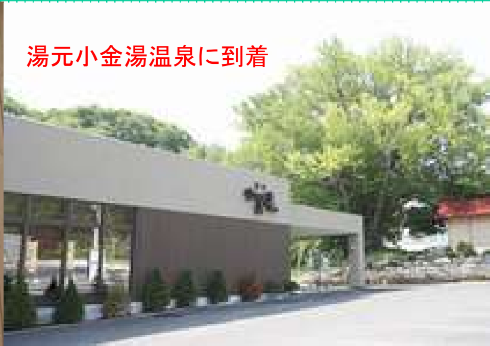
湯元小金湯温泉に到着