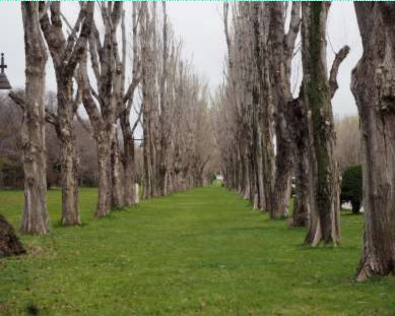
ポプラ並木・・・剪定作業がされてました