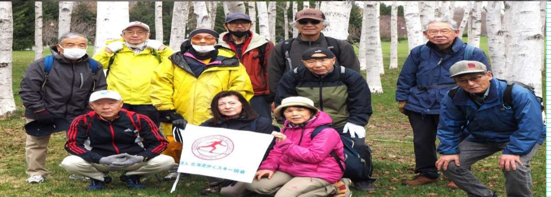
白さが際立つ白樺をバックに集合記念写真・・・皆さん笑顔です・・・