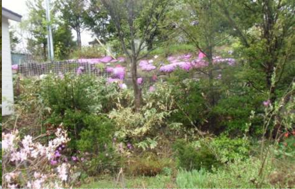
住宅庭・・・ツツジ・芝桜等見ながら・・・