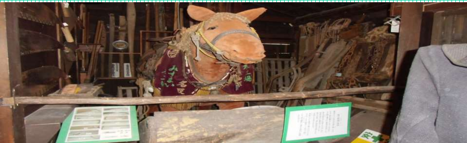
保存会の皆さんが手作りしたぬいぐるみがある・・・馬小屋の展示 林業に使われた様々な道具がぎっしり並んでいた