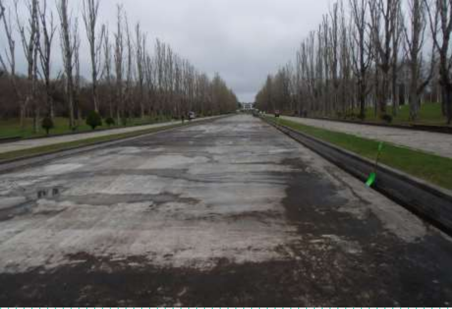
カナル全景・・・水はまだ入ってませんでした