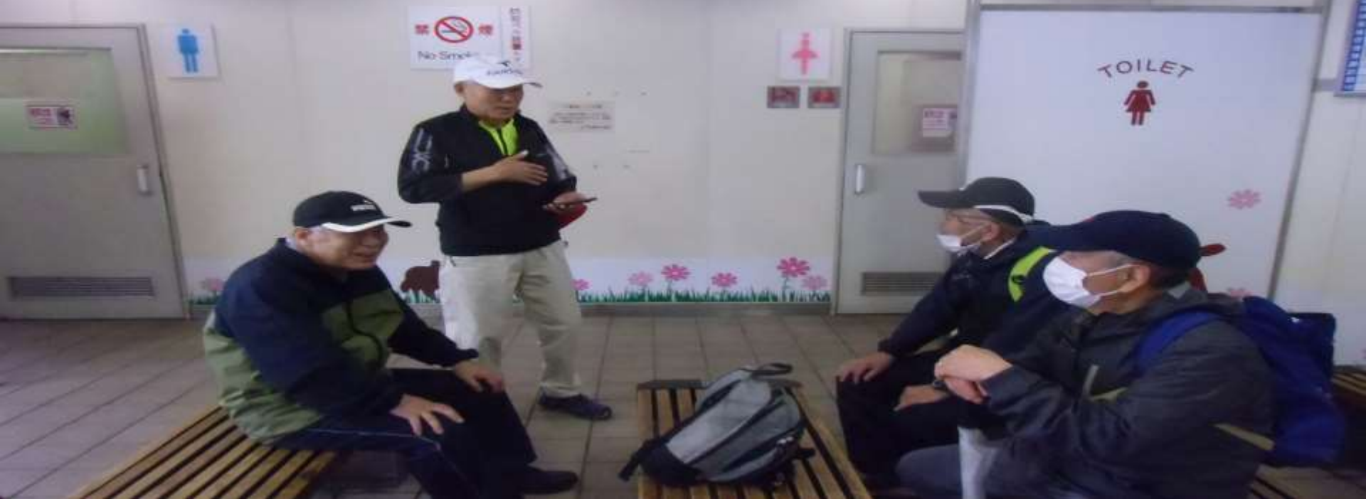
ミーティング終了後バスを待つ一行(上)