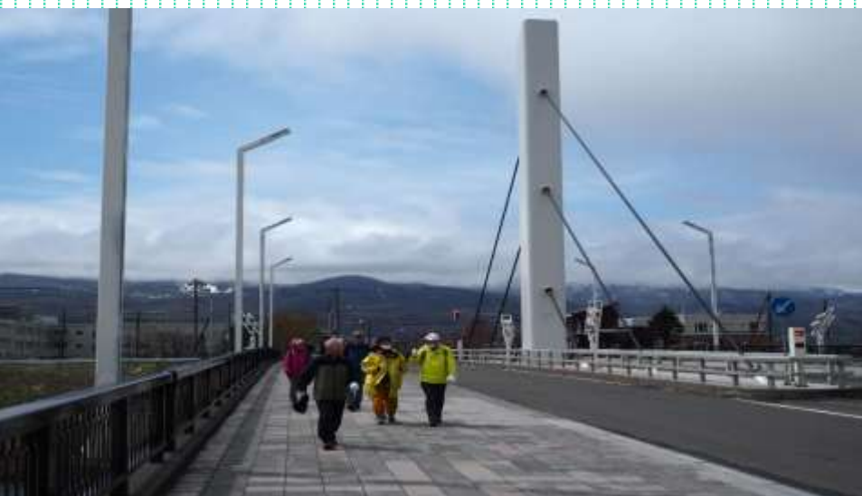
おしゃれな前田森林公園橋を行く一行