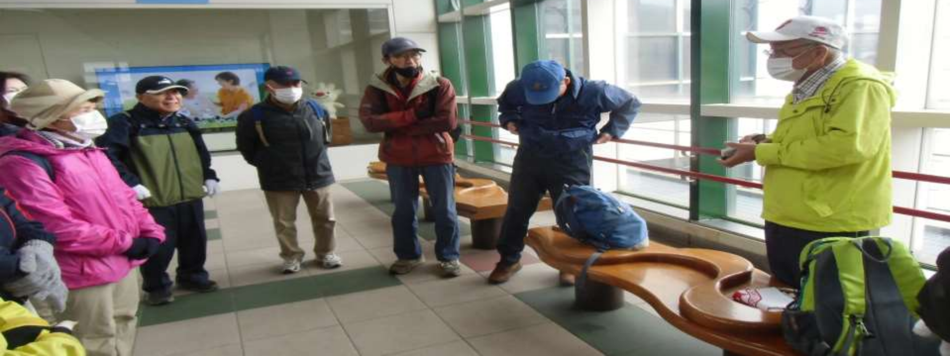
JR手稲駅2Fコンコース広場 出発前のミーティング