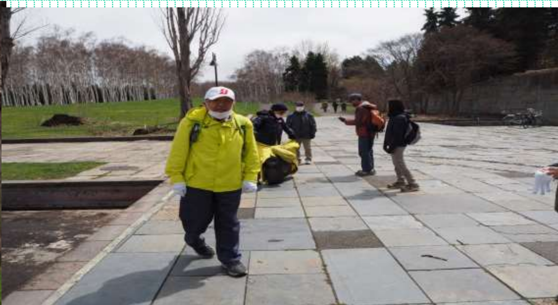
公園内は各自・・・自由散策で楽しみました