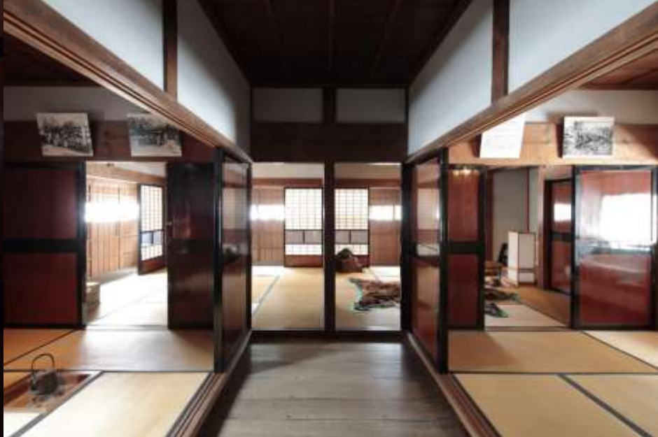
明治初期に本願寺道路を往来する人が休んだ部屋が・・・そのままに残っている(上)