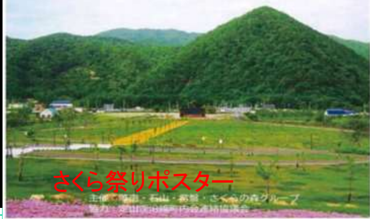
さくら祭りポスター