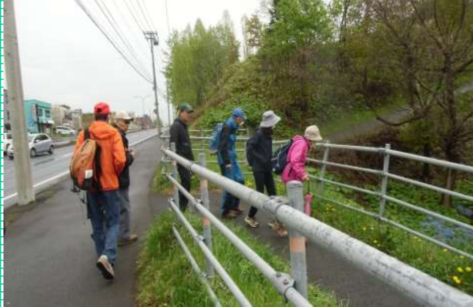
東簾舞でバス停下車し坂道を下りる