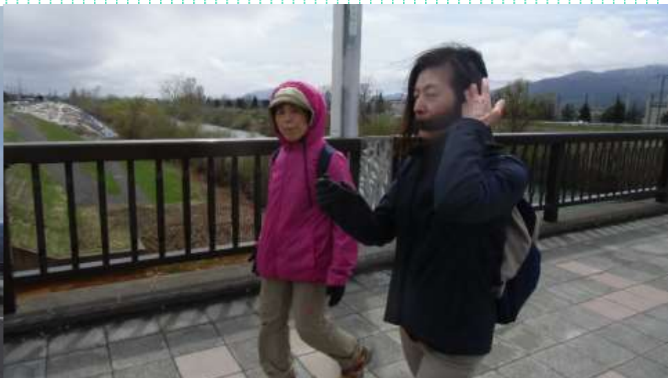
まだまだ余力あります・前田公園も近い