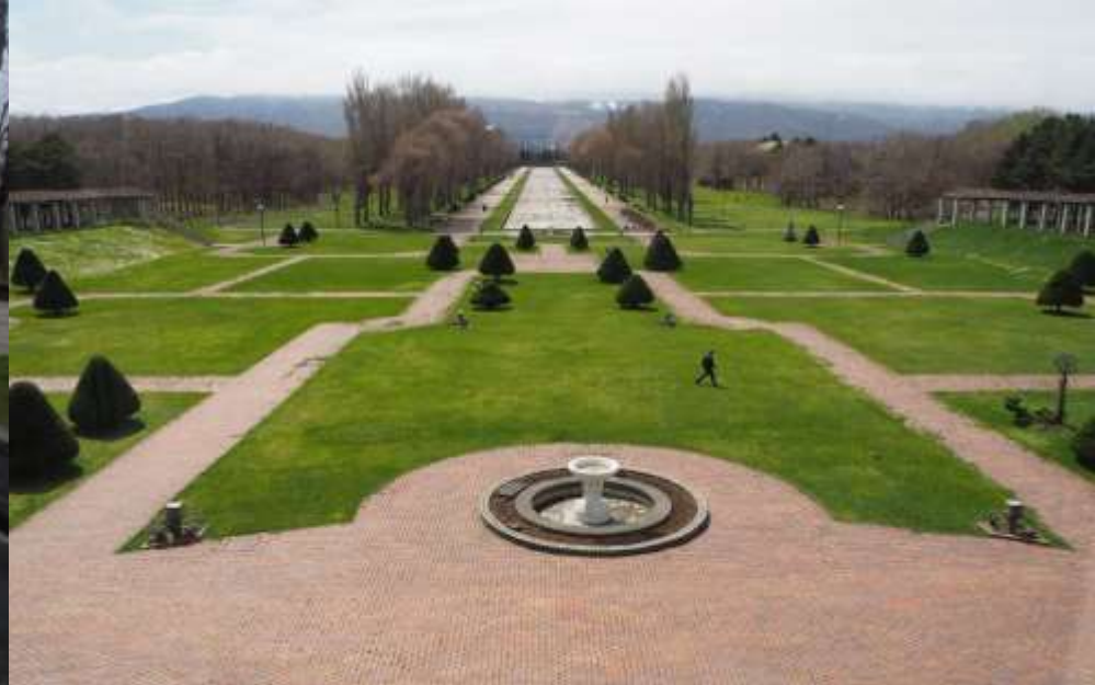
展望台から見た洋風庭園・カナルを含む大パノラマ