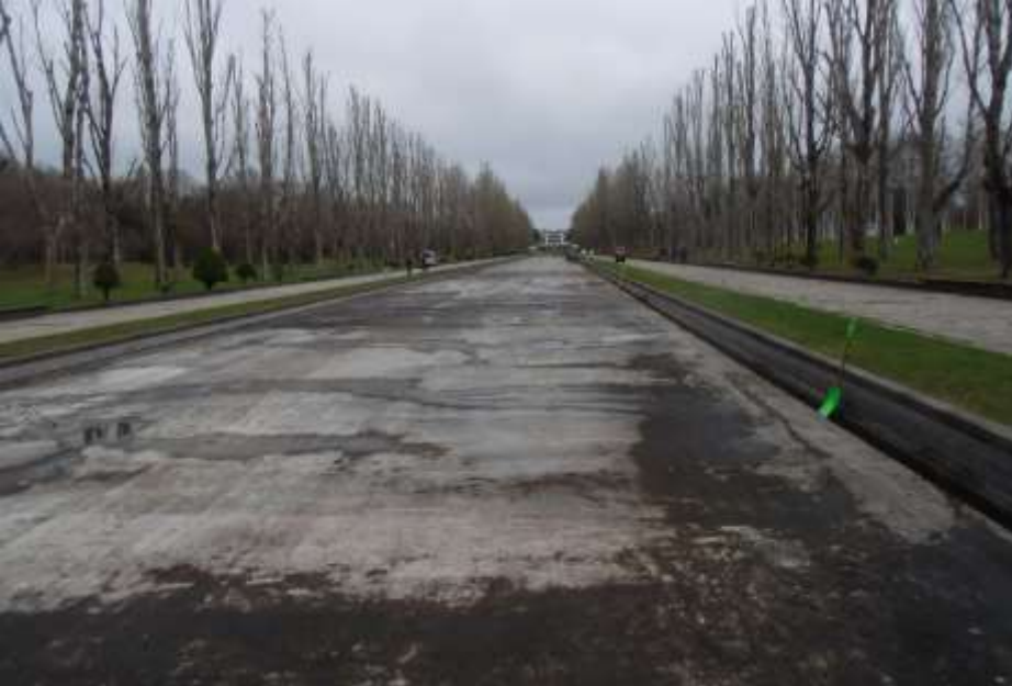
カナル全景・・・水はまだ入ってませんでした