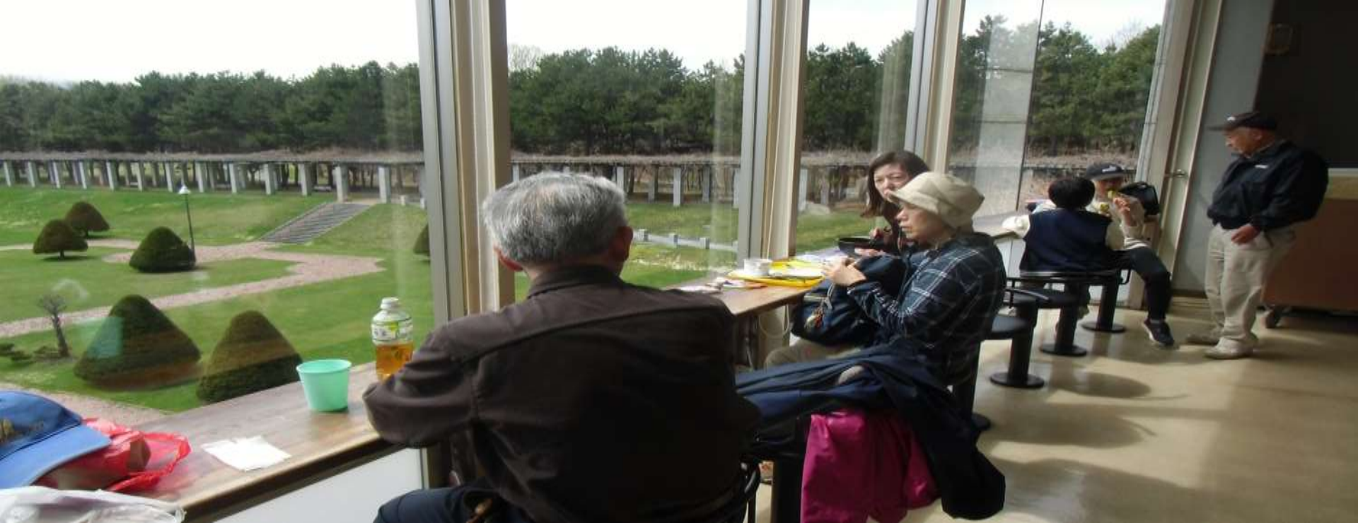
展望ラウンジで景観を楽しみ休憩しました(上) その後バス停に向かう一行(下)