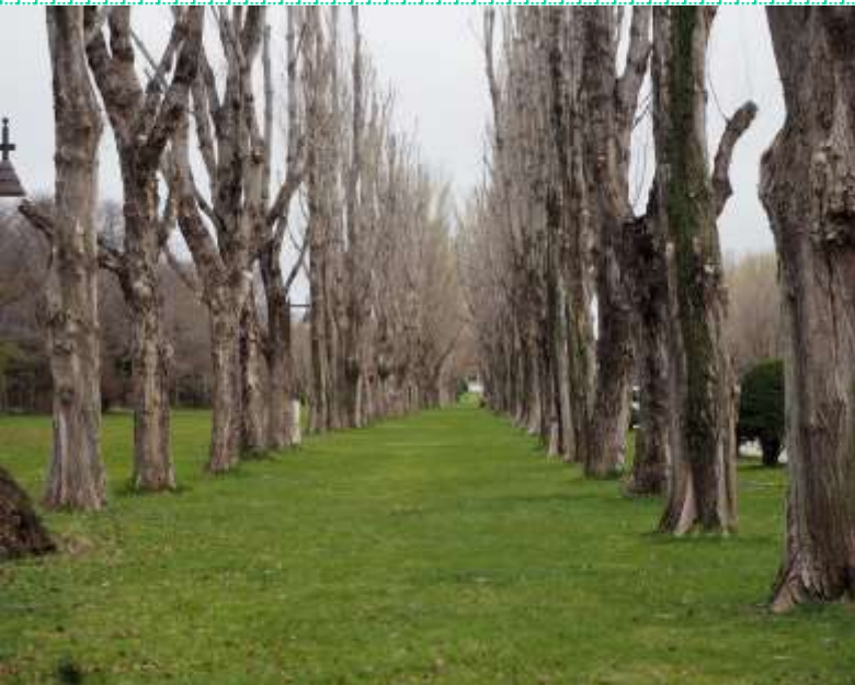
ポプラ並木・・・剪定作業がされてました