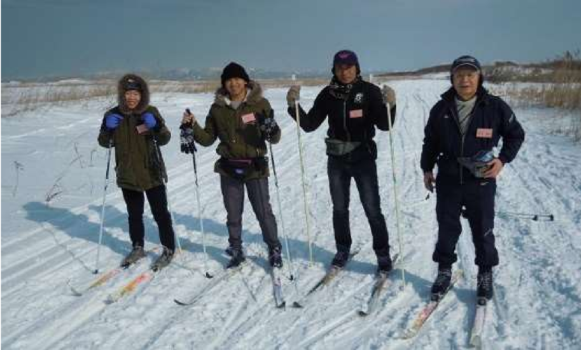
ベトナムの研修生3名と付き添いの方の指導官