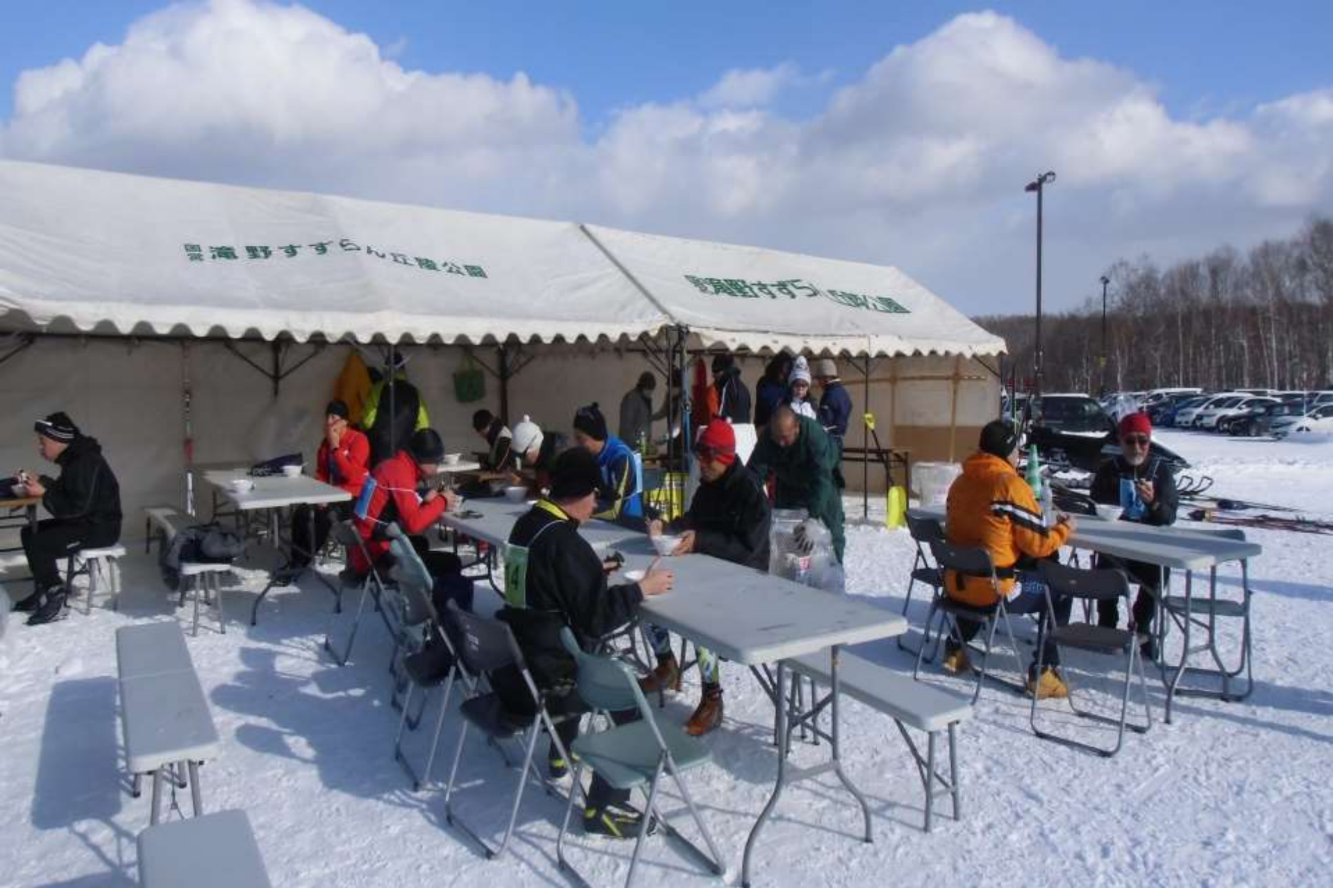
ゴール後豚汁等食事する選手