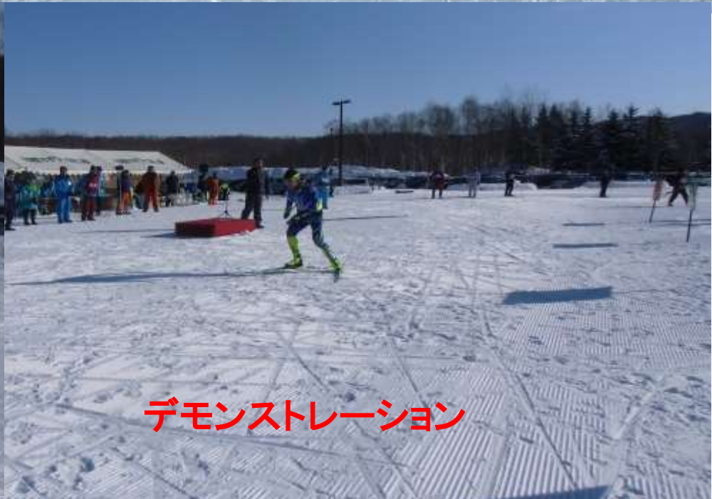
デモンストレーション