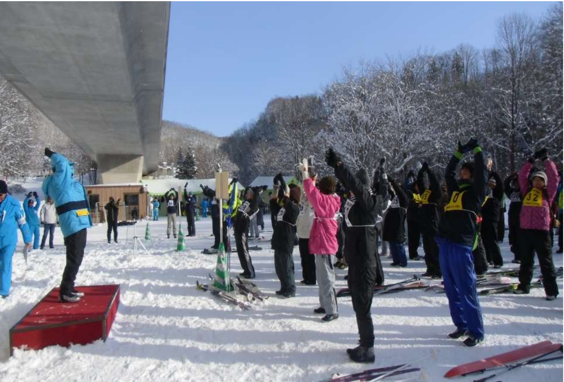
準備体操をする選手