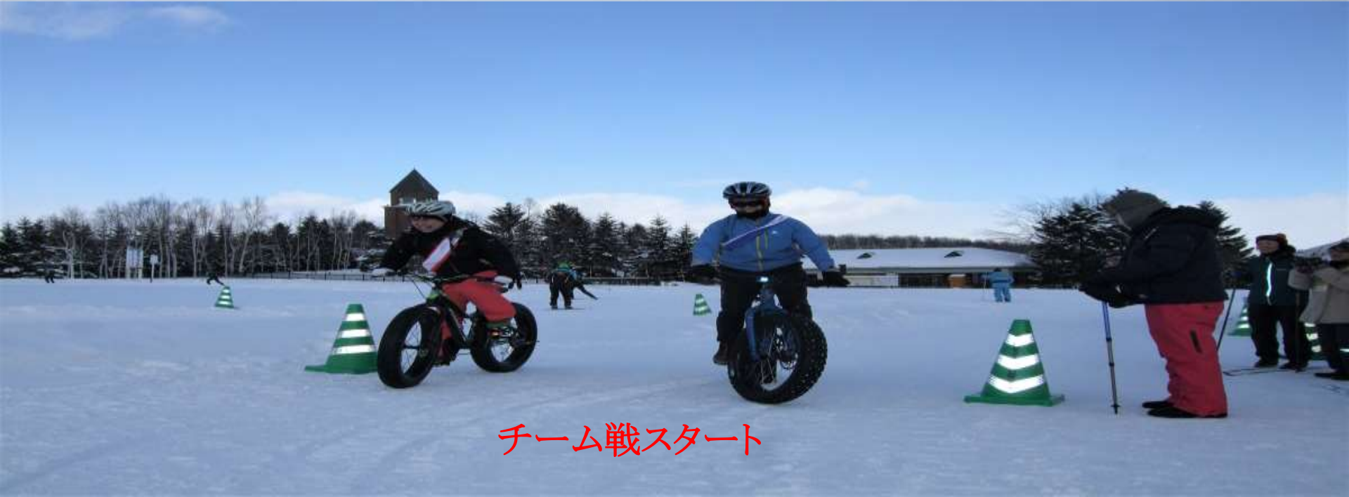
チーム戦スタート