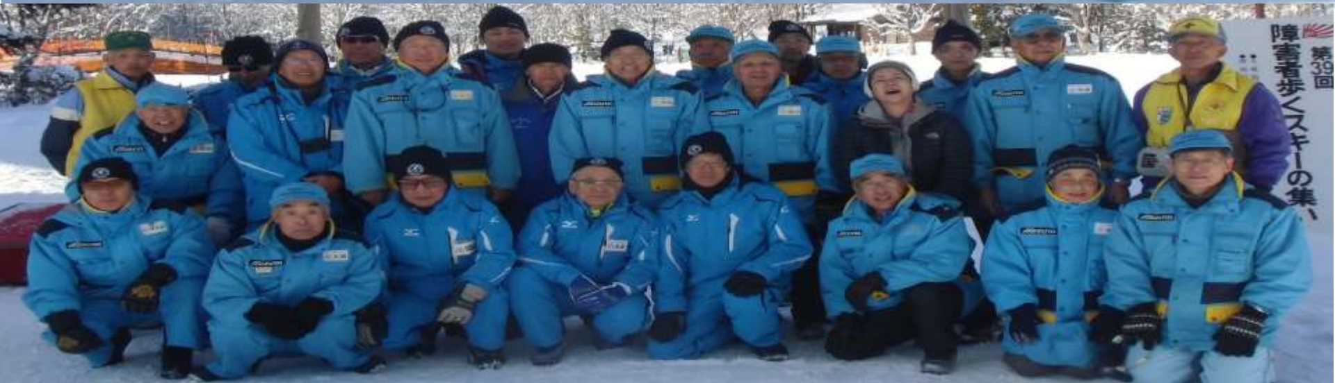
大会運営スタッフ集合記念写真