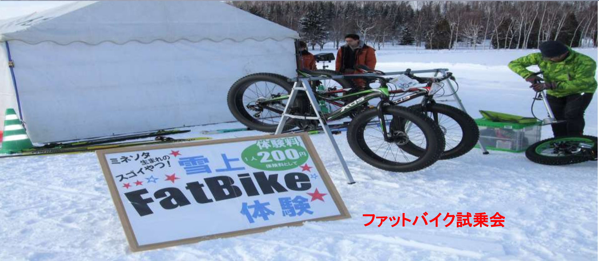
ファットバイク試乗会