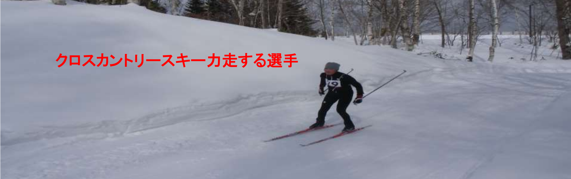
クロスカントリースキー力走する選手