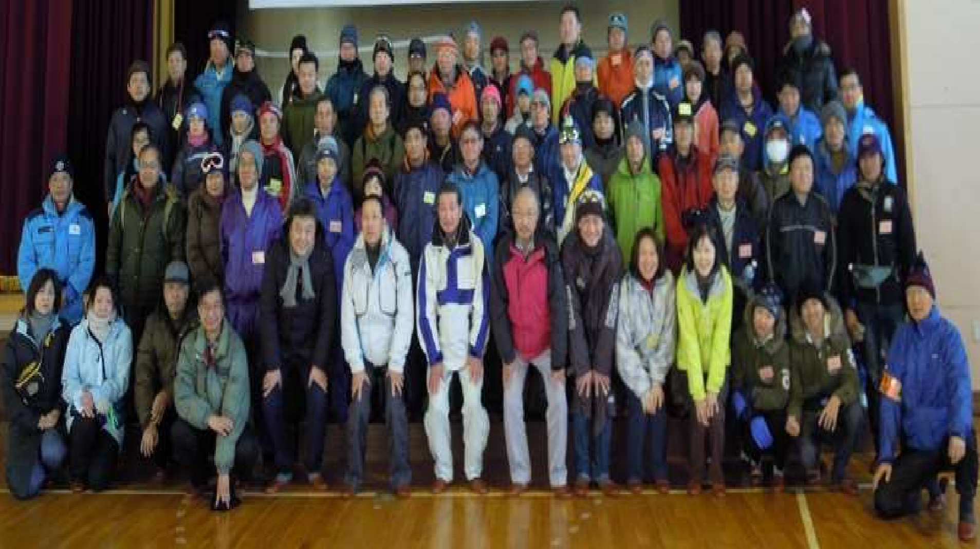
第40回 石狩浜歩くスキー&かんじきウォーキングの集い記念写真