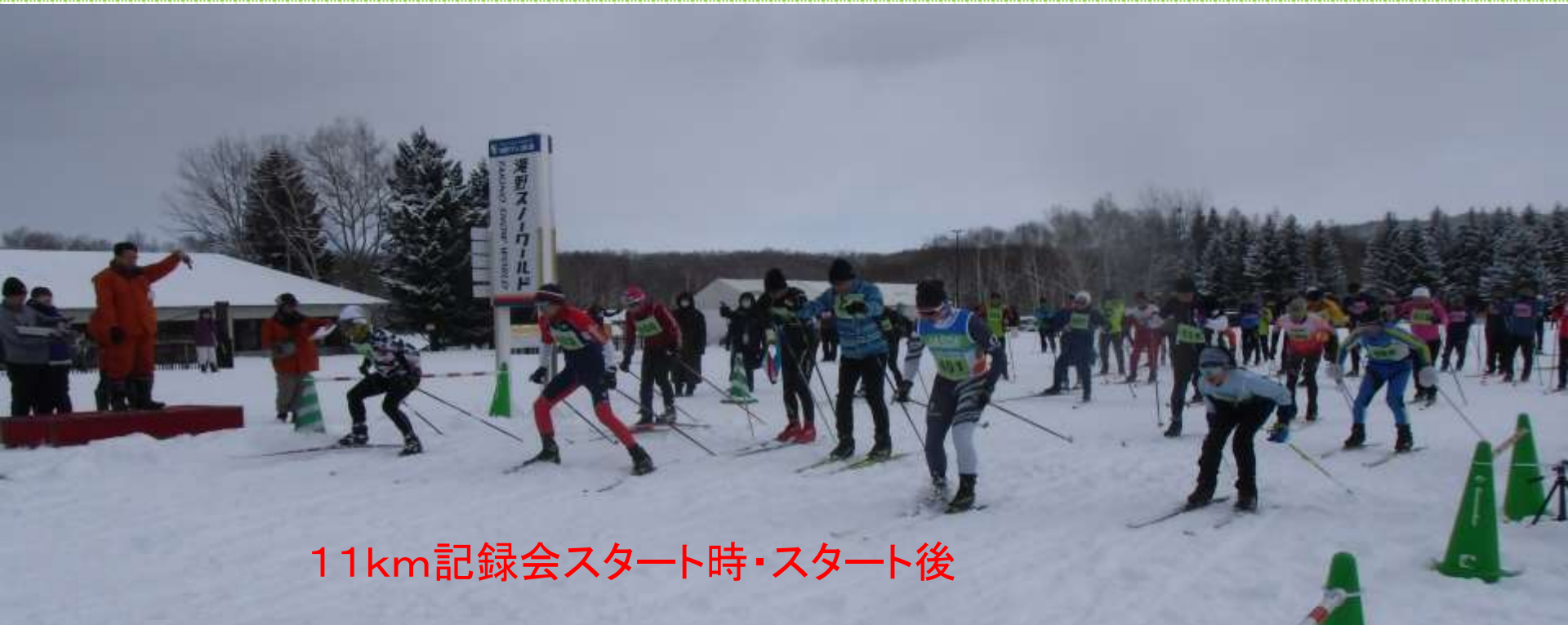
11km記録会スタート時・スタート後