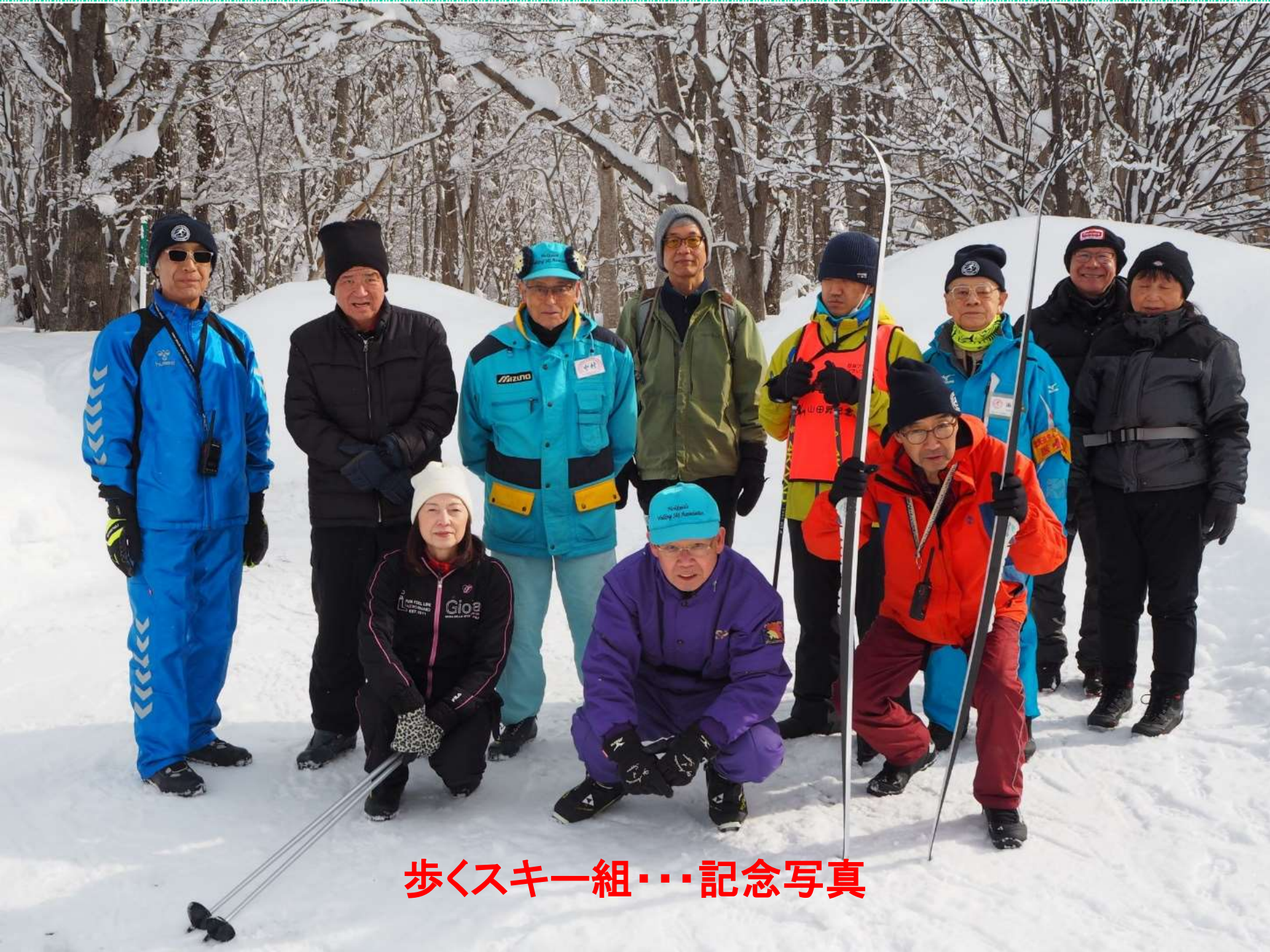
歩くスキー組・・・記念写真