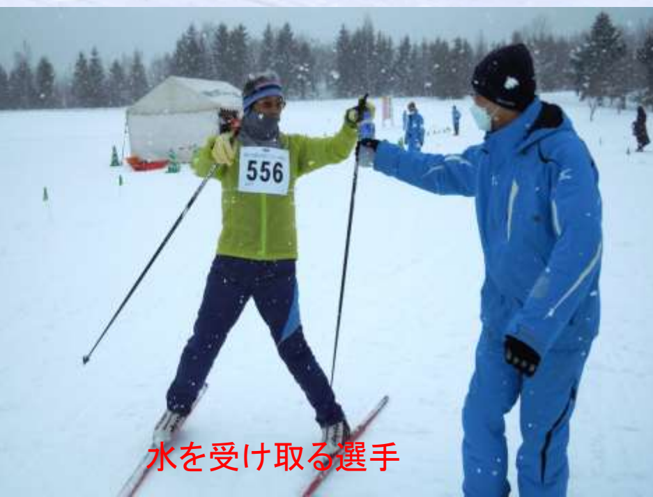
水を受け取る選手