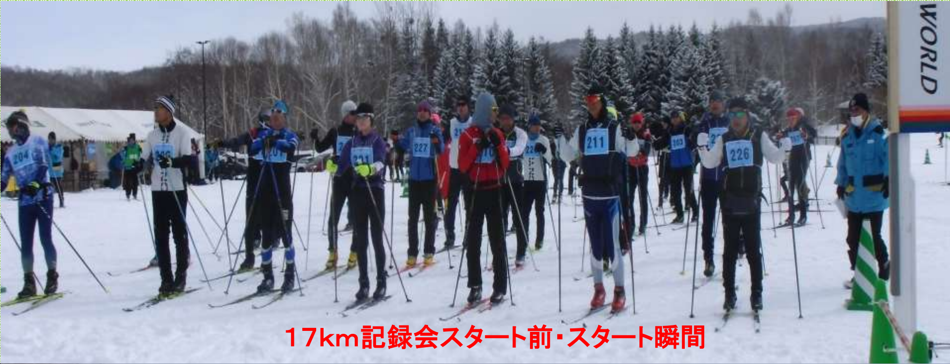
17km記録会スタート前・スタート瞬間