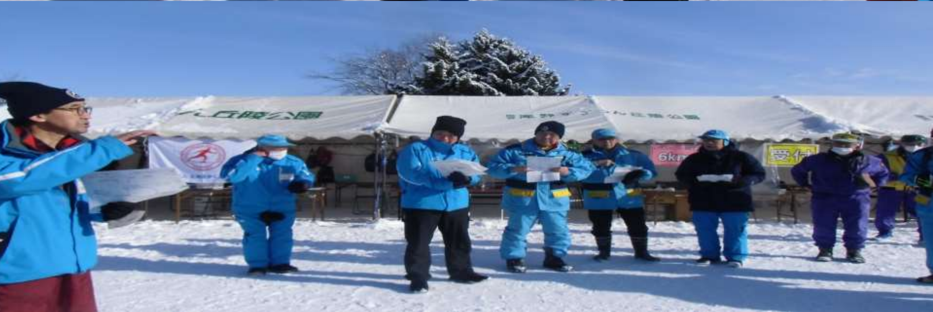
8:45・開催前の全体ミーティング