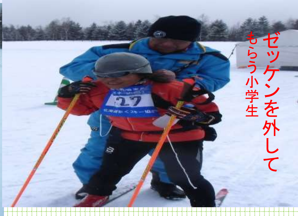
ゼッケンを外して もらう小学生