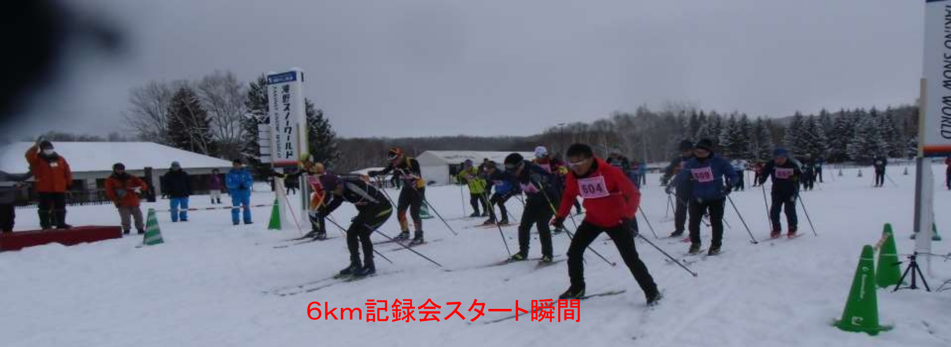
6km記録会スタート瞬間