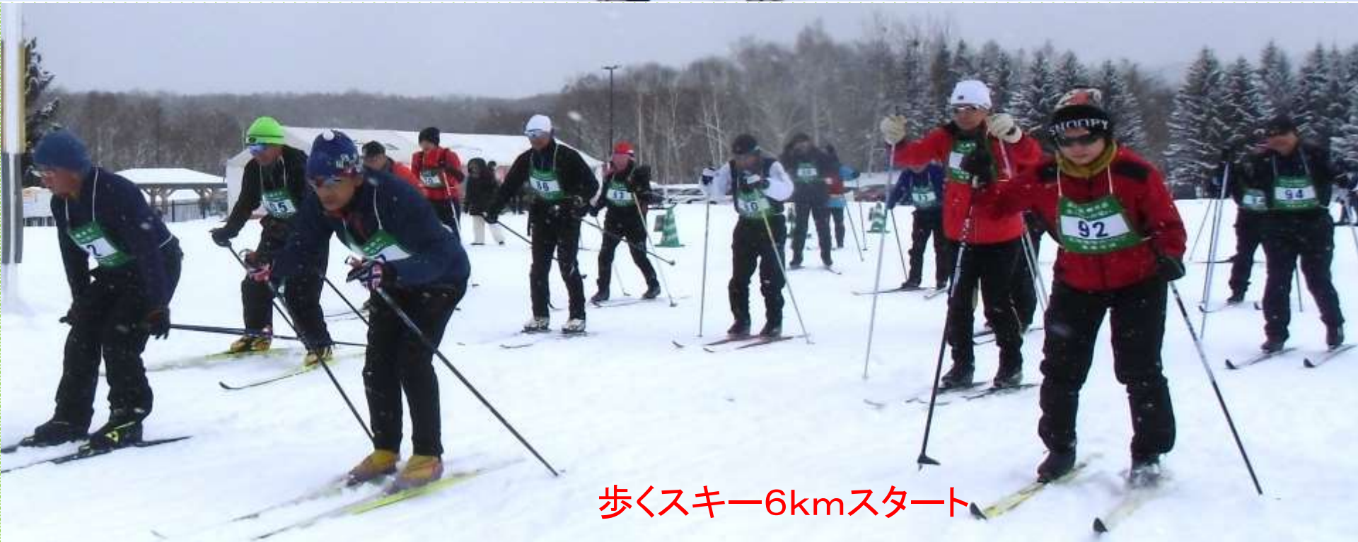
歩くスキー6kmスタート