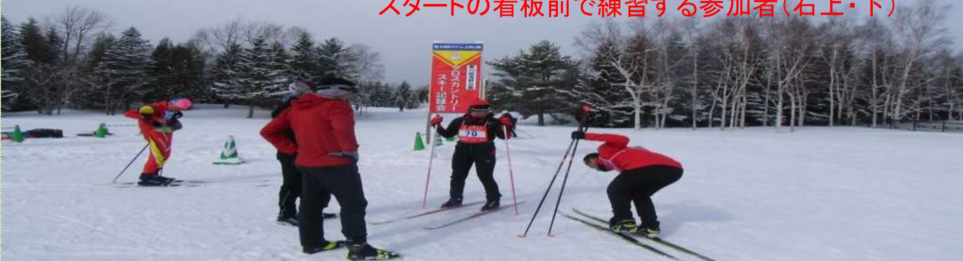
スタートの看板前で練習する参加者(右上・下)