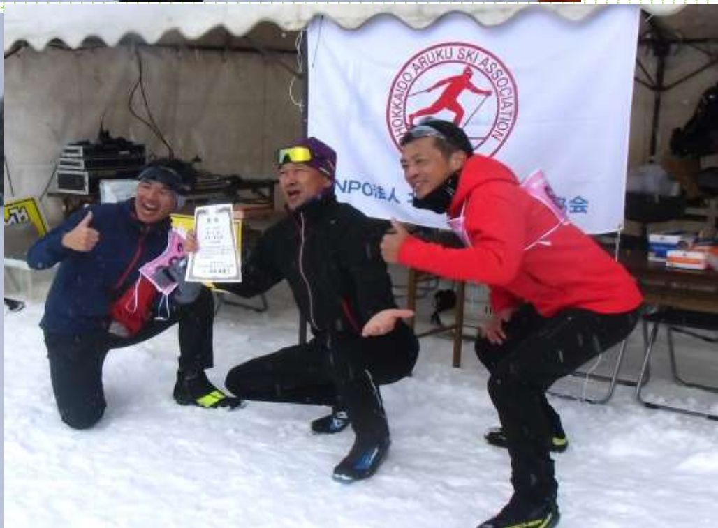
表彰されて記念写真・・・