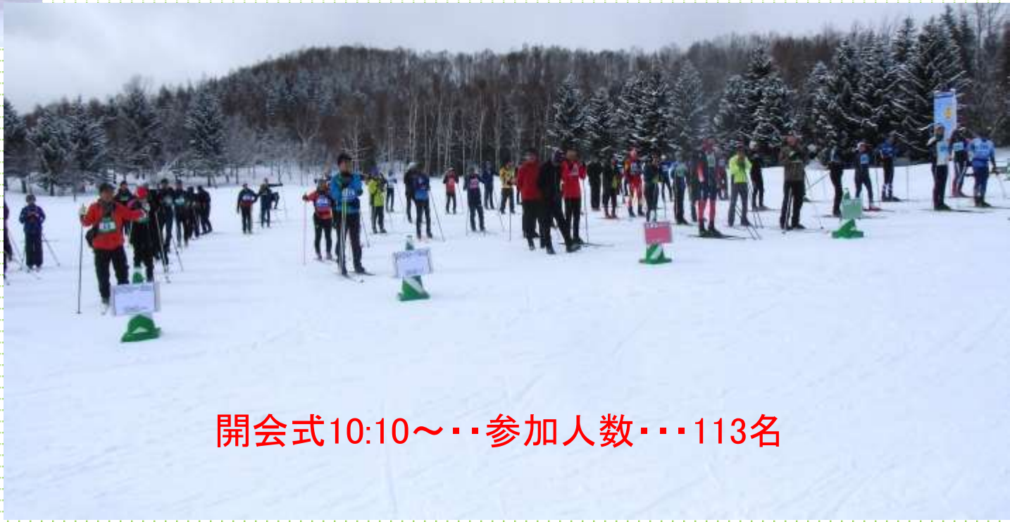
開会式10:10～・・・参加人数・・・113名