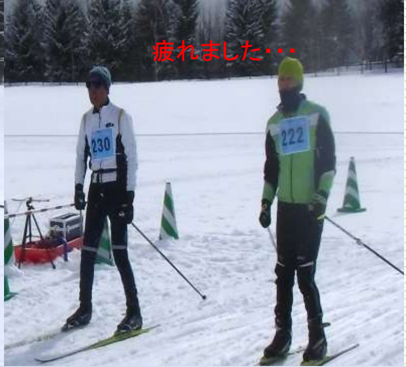
疲れました・・・