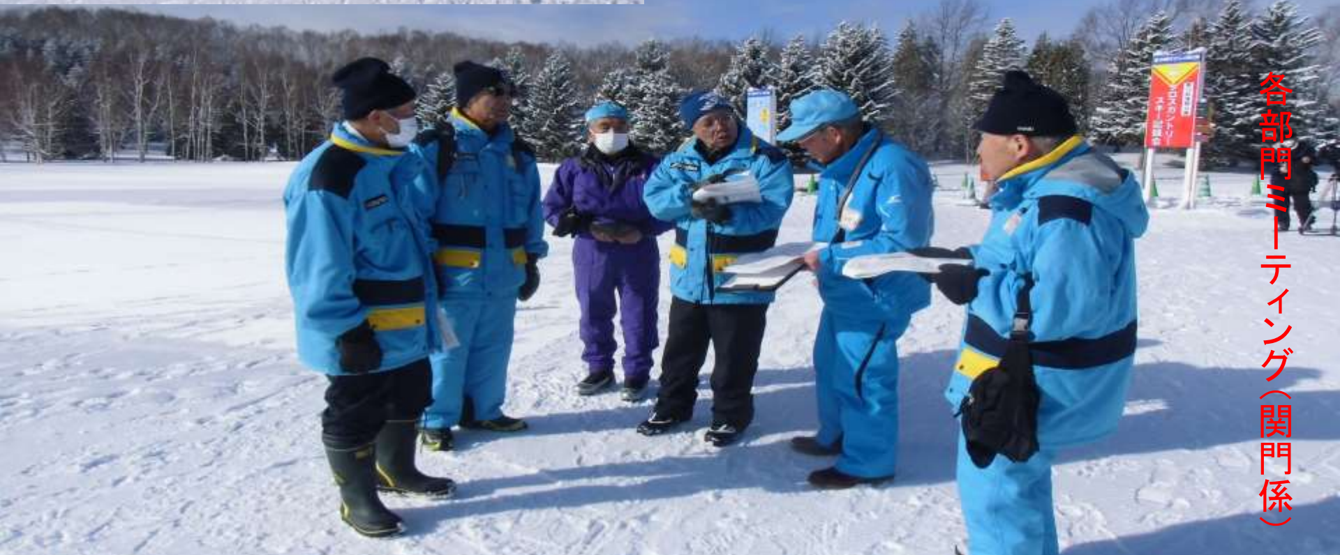
各部門ミーティング(関門係)