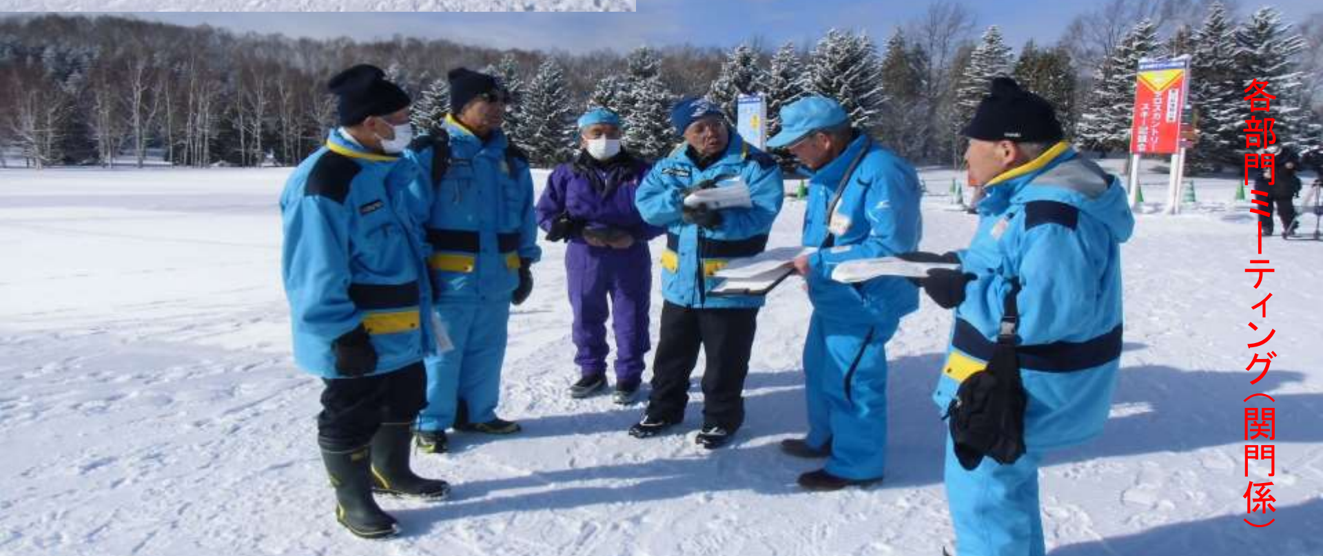
各部門ミーティング(関門係)