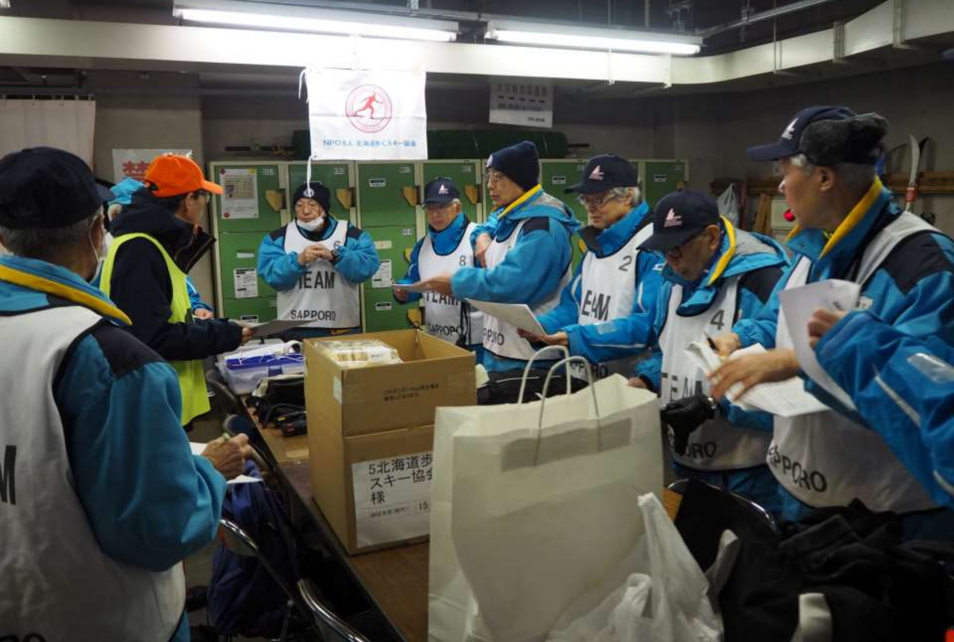
大会前の確認ミーティング7時30分過ぎ