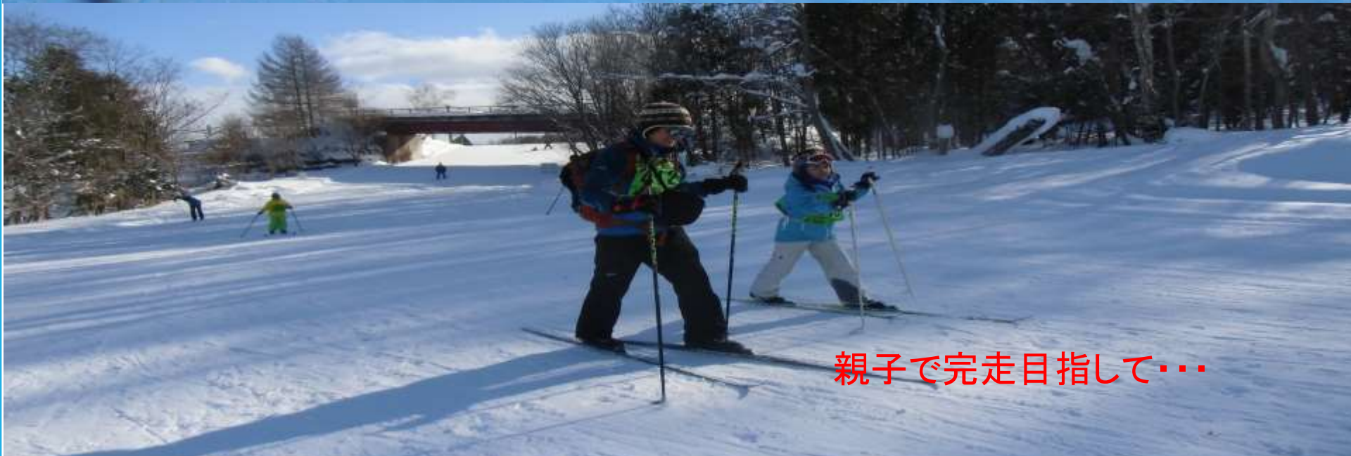
親子で完走目指して・・・