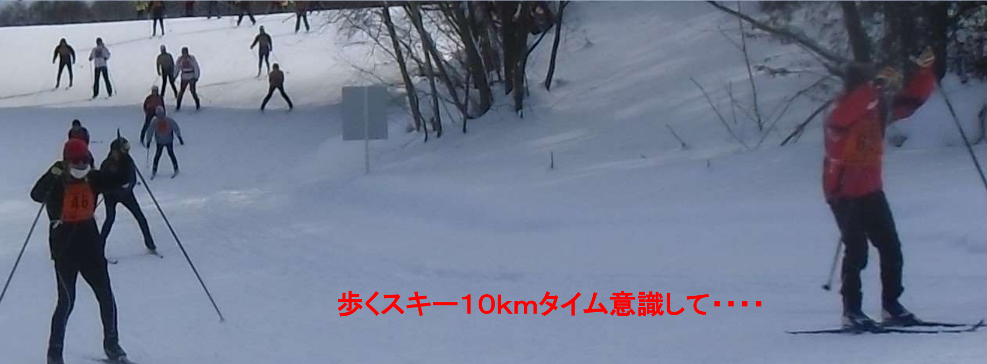
歩くスキー10kmタイム意識して……