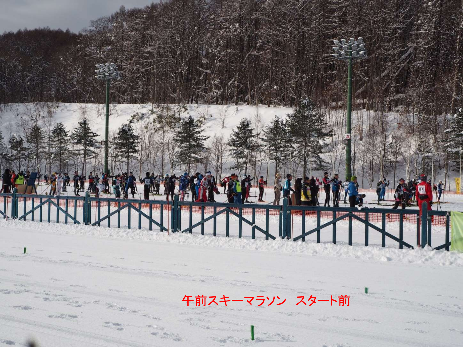
午前スキーマラソン スタート前