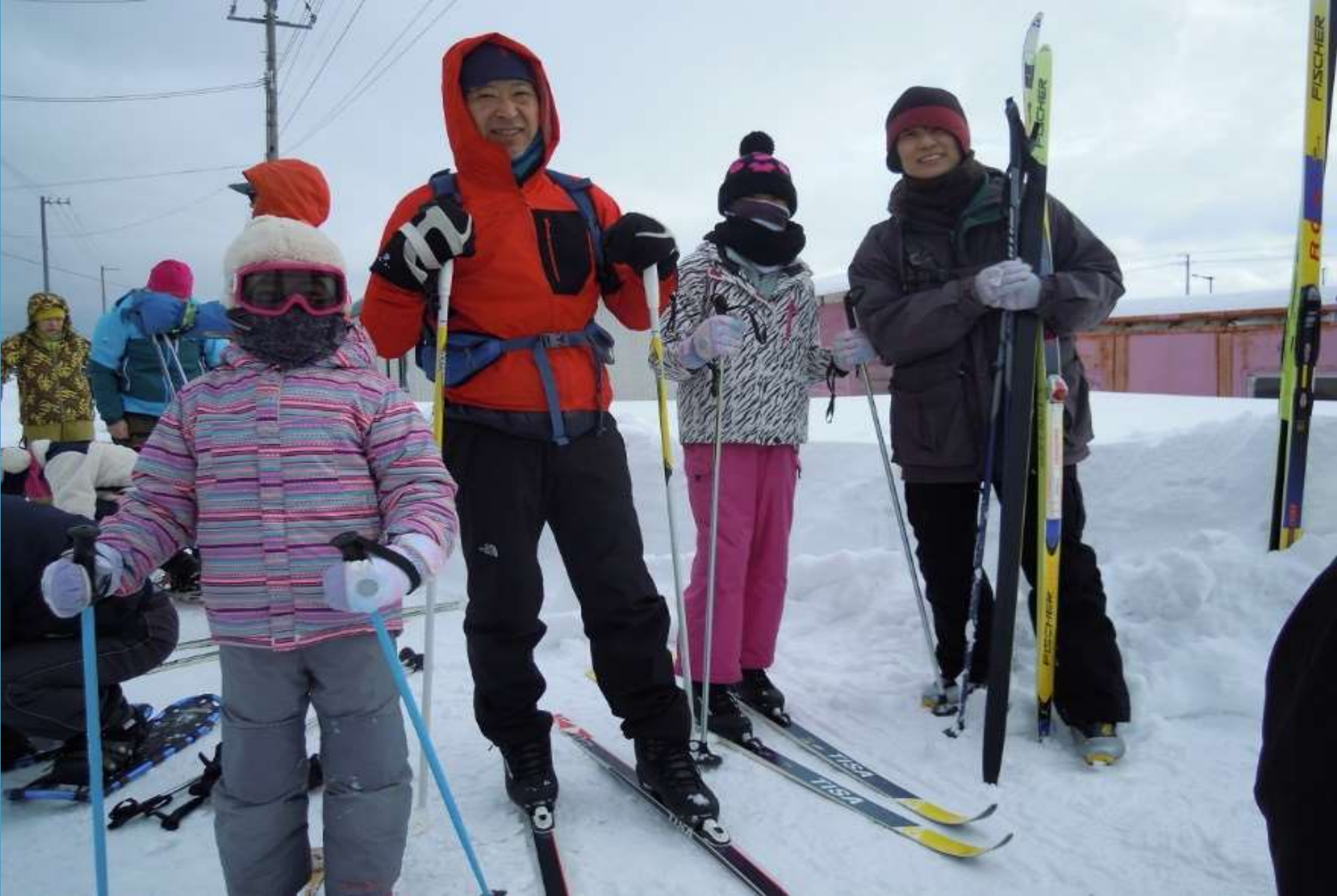
お父さん、お母さんと参加の小学生姉妹