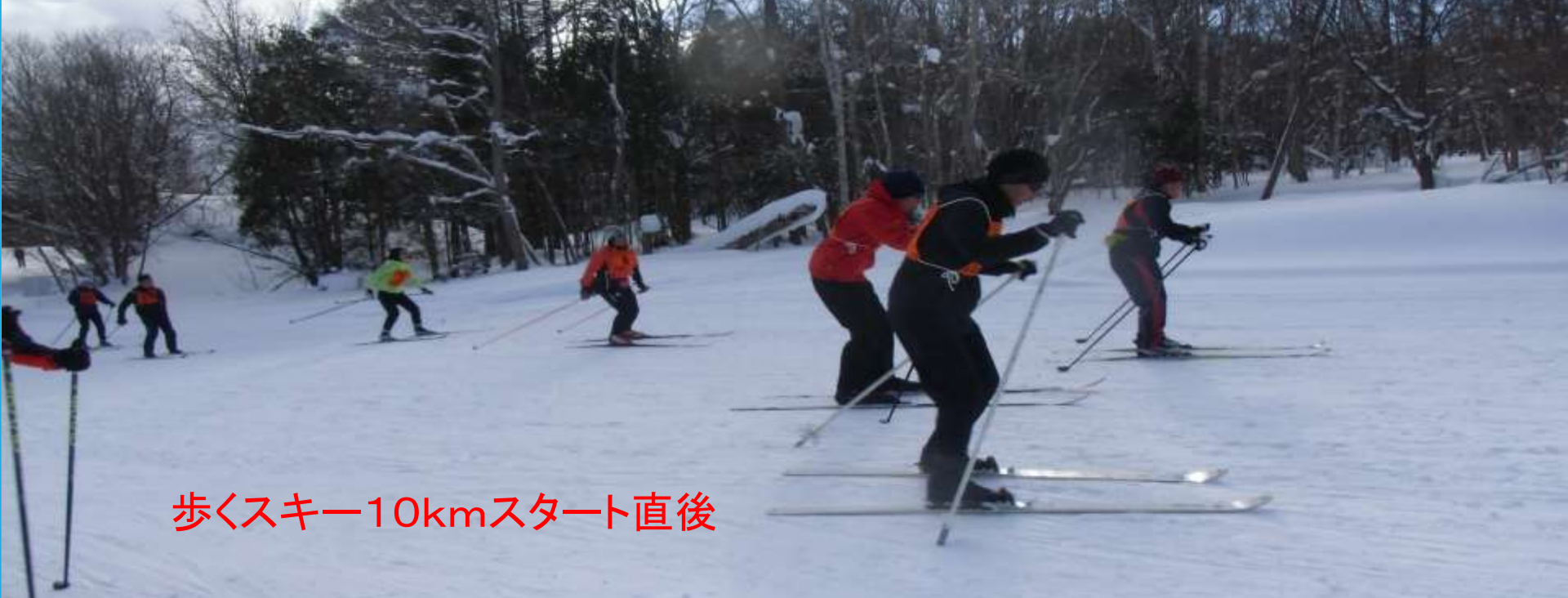
歩くスキー10kmスタート直後