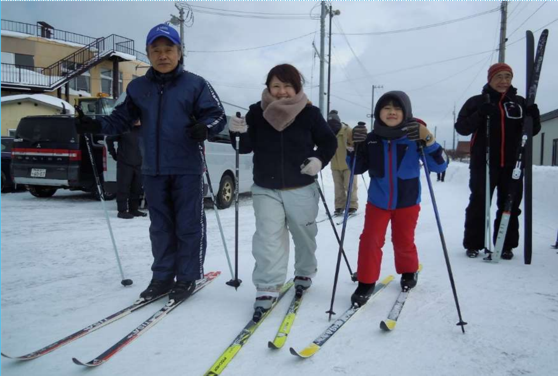
おじいちゃん、お母さんと参加の小学生・・・出発前