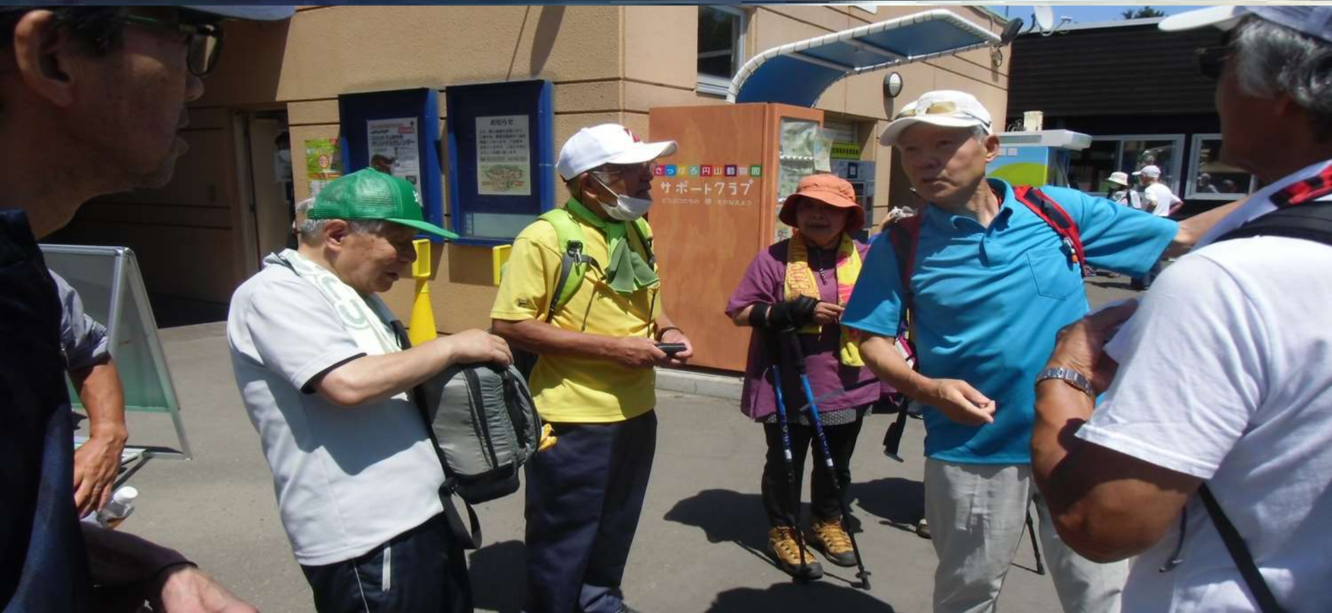
円山動物園西口に到着致しました・・・暑さと坂道で疲れたが・・・まだまだ元気です