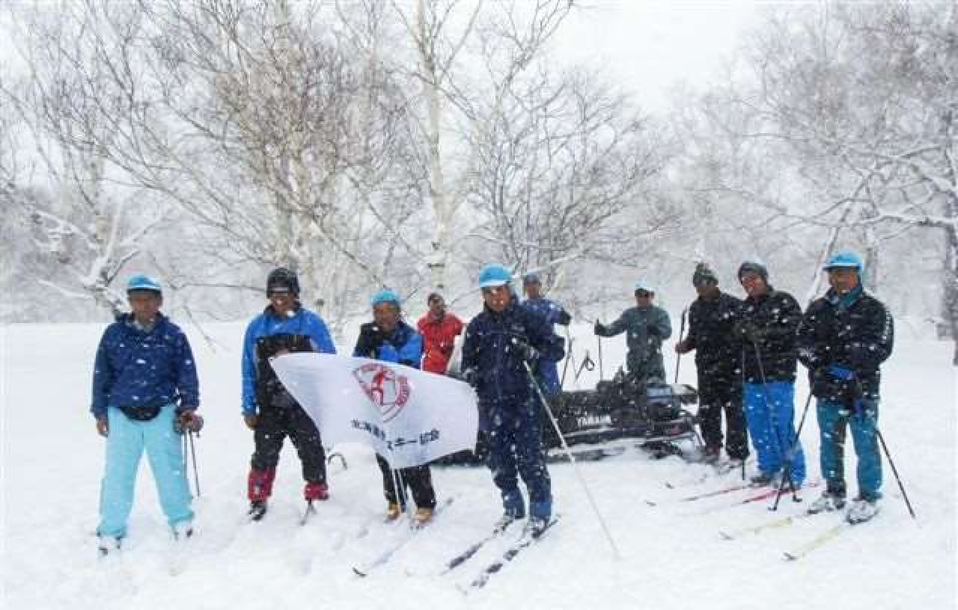
折り返し地点965ポイント周辺の健脚組