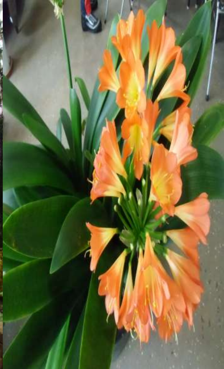
室内公園色彩館・ランが一杯