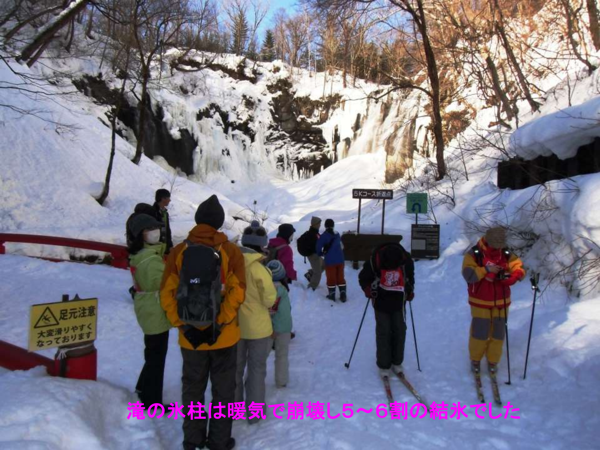
滝の氷柱は暖気で崩壊し5~6割の結氷でした