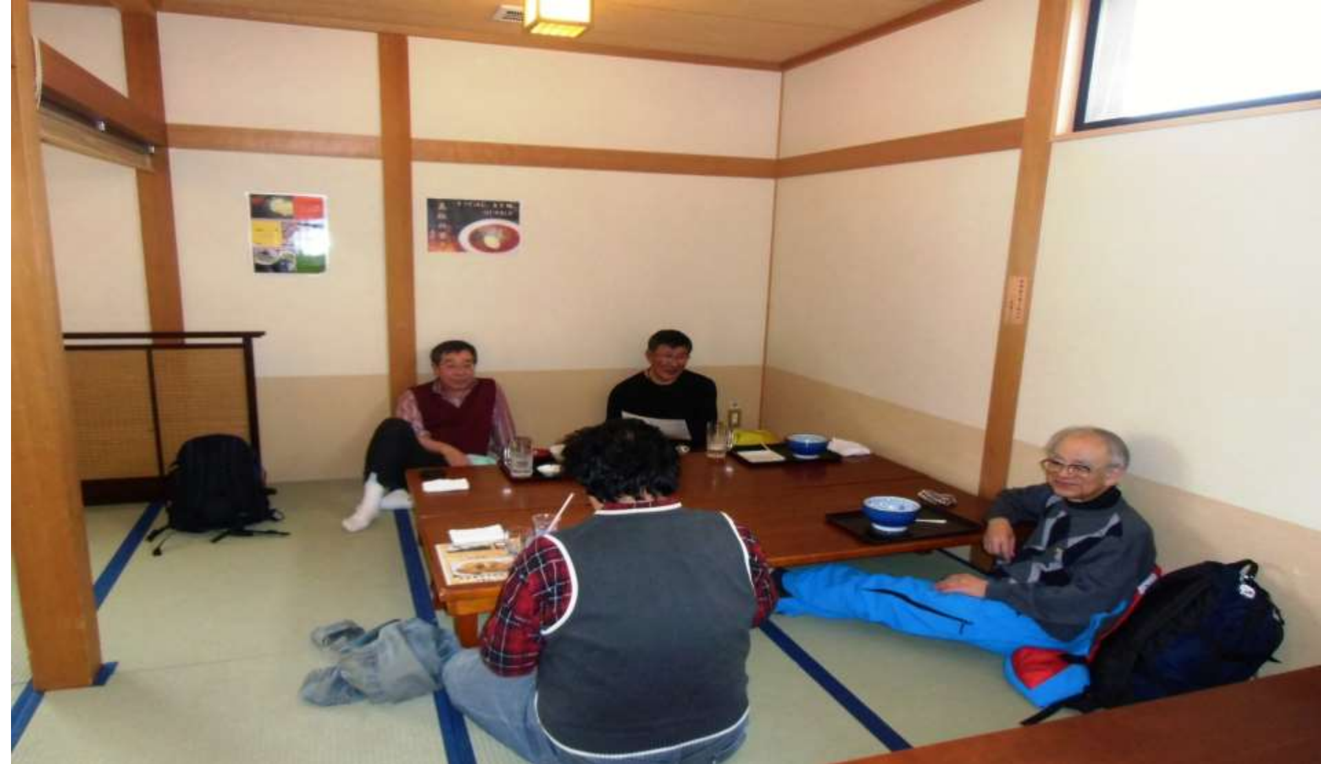
湯本岩見沢温泉なごみ入浴後 昼食とビールで懇親