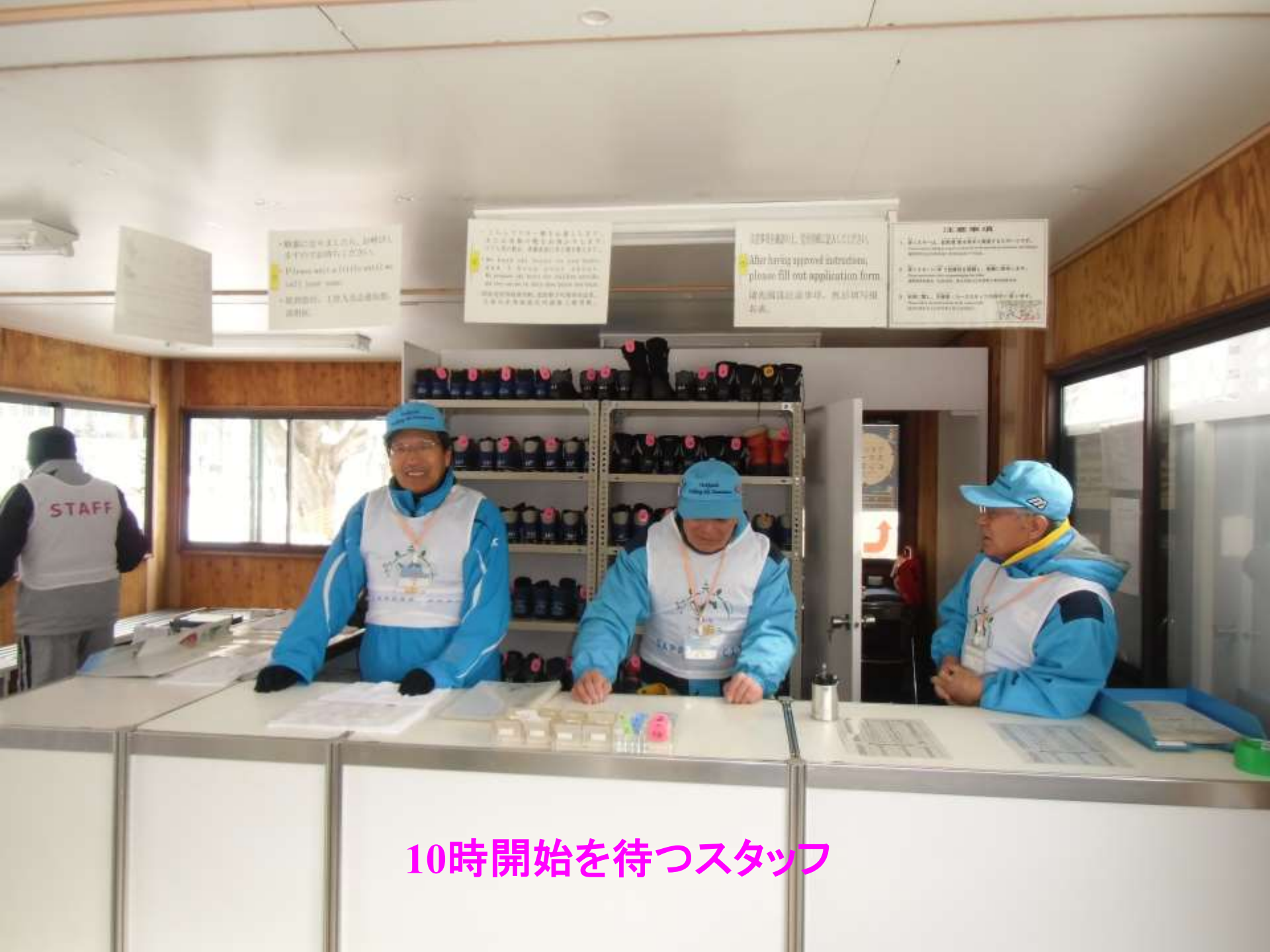
10時開始を待つスタッフ