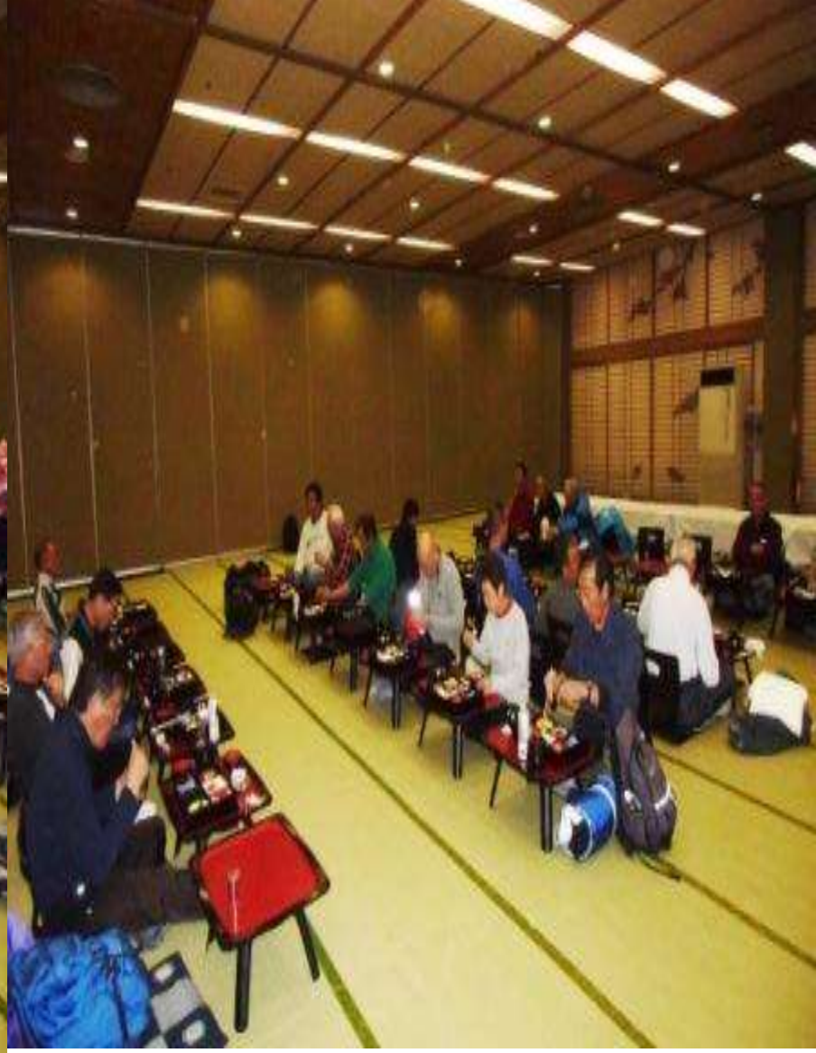
定山溪温泉入浴後食事・ビール等で懇親