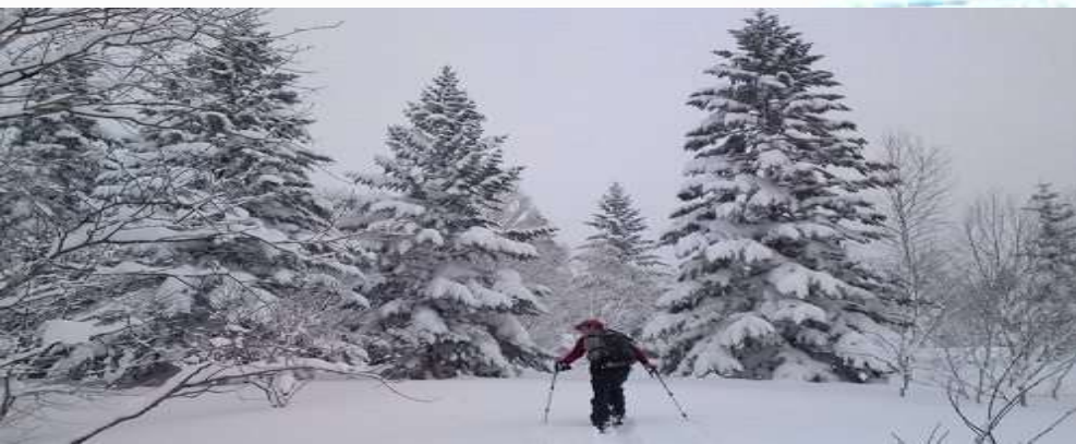
ダテカンバの幹にネジネジ状態に雪をまとった姿