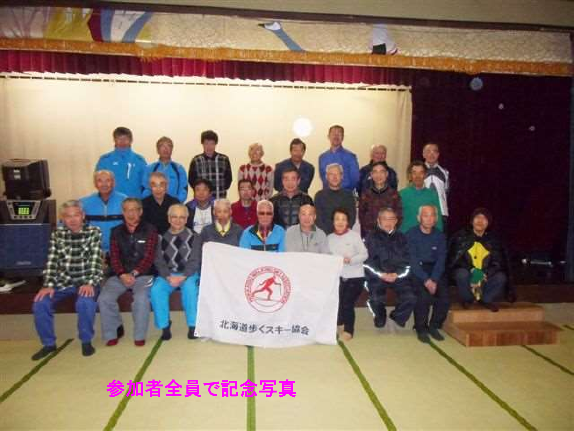
参加者全員で記念写真