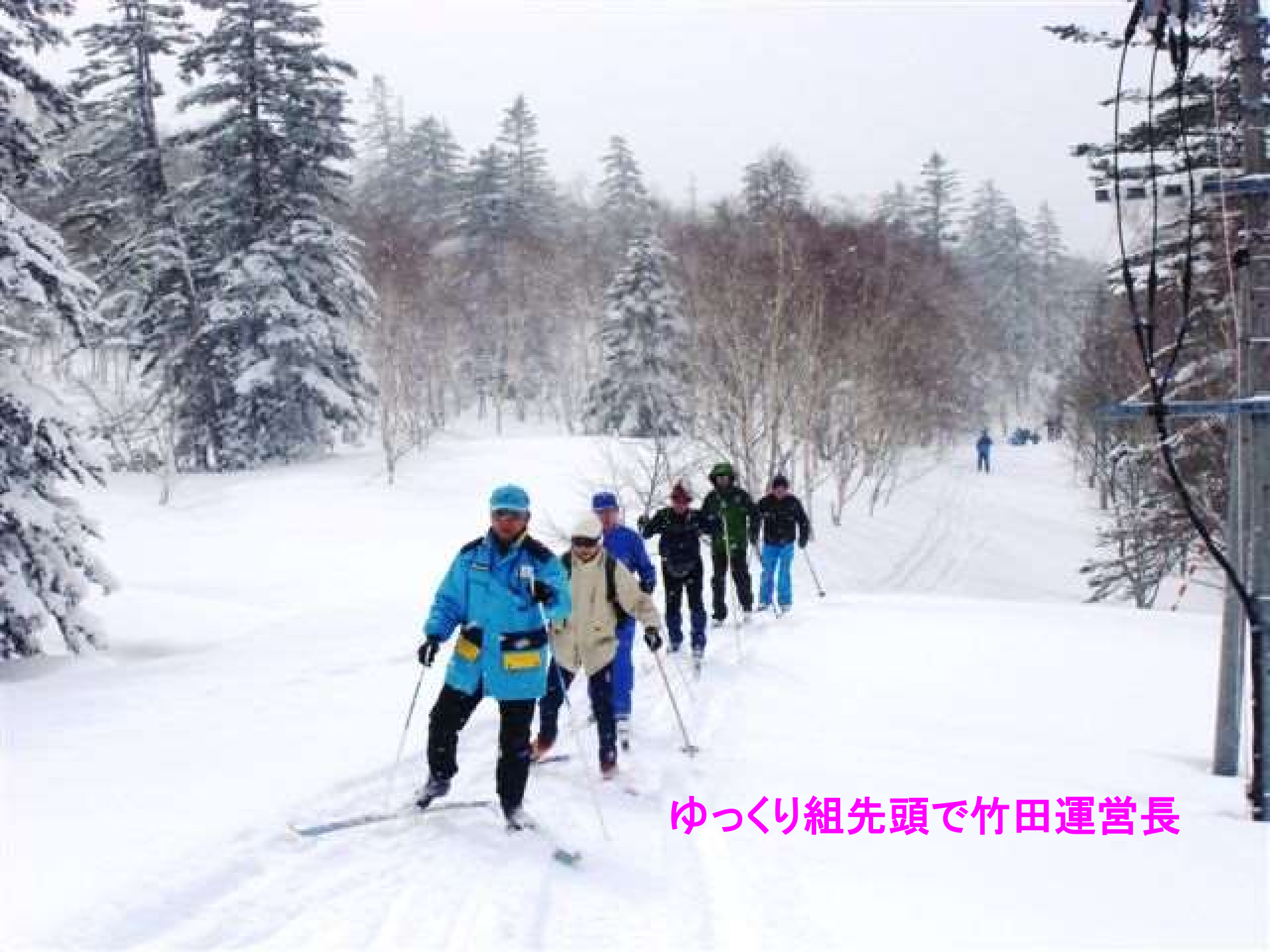
ゆっくり組先頭で竹田運営長