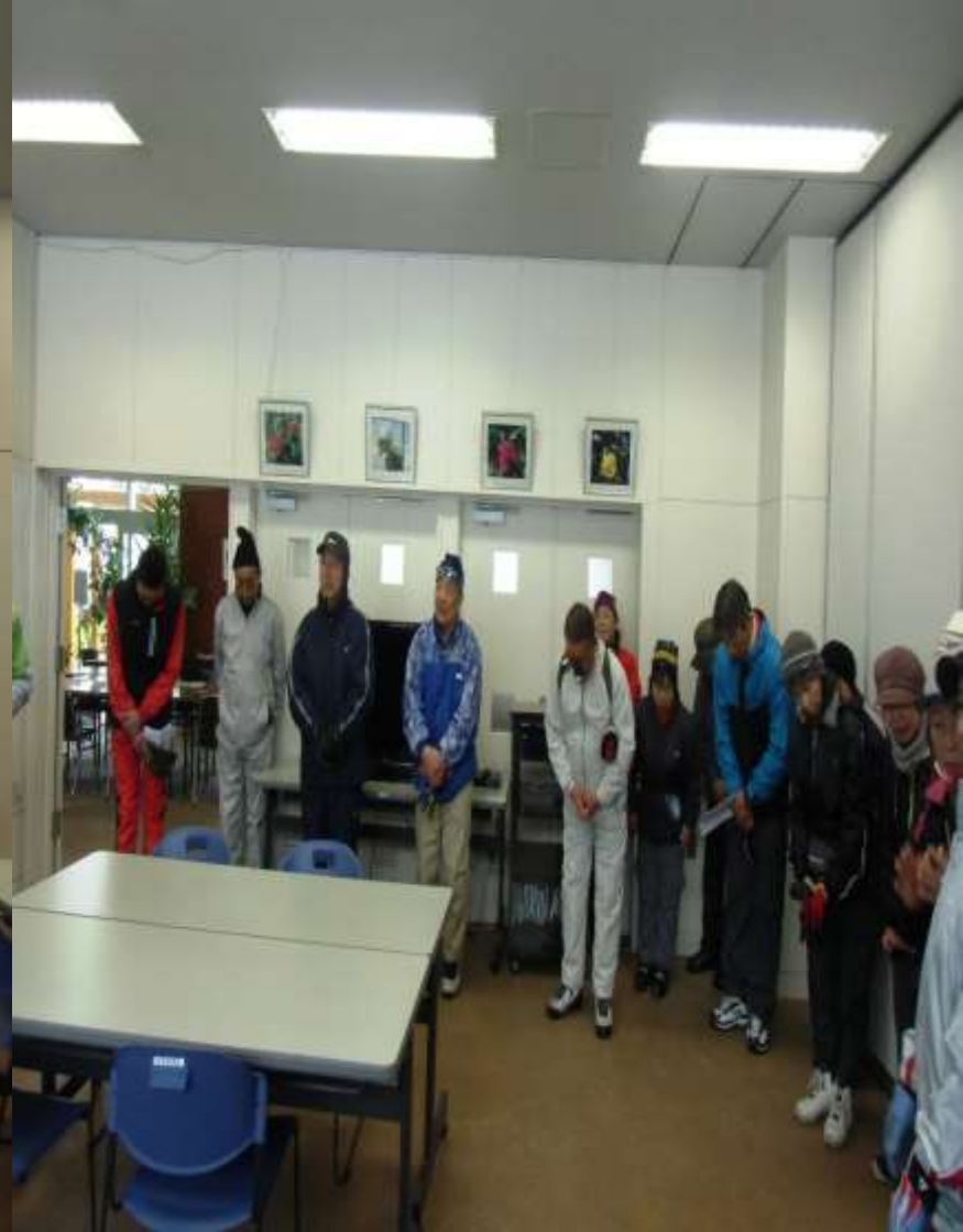
岩見沢スキー連盟の参加者