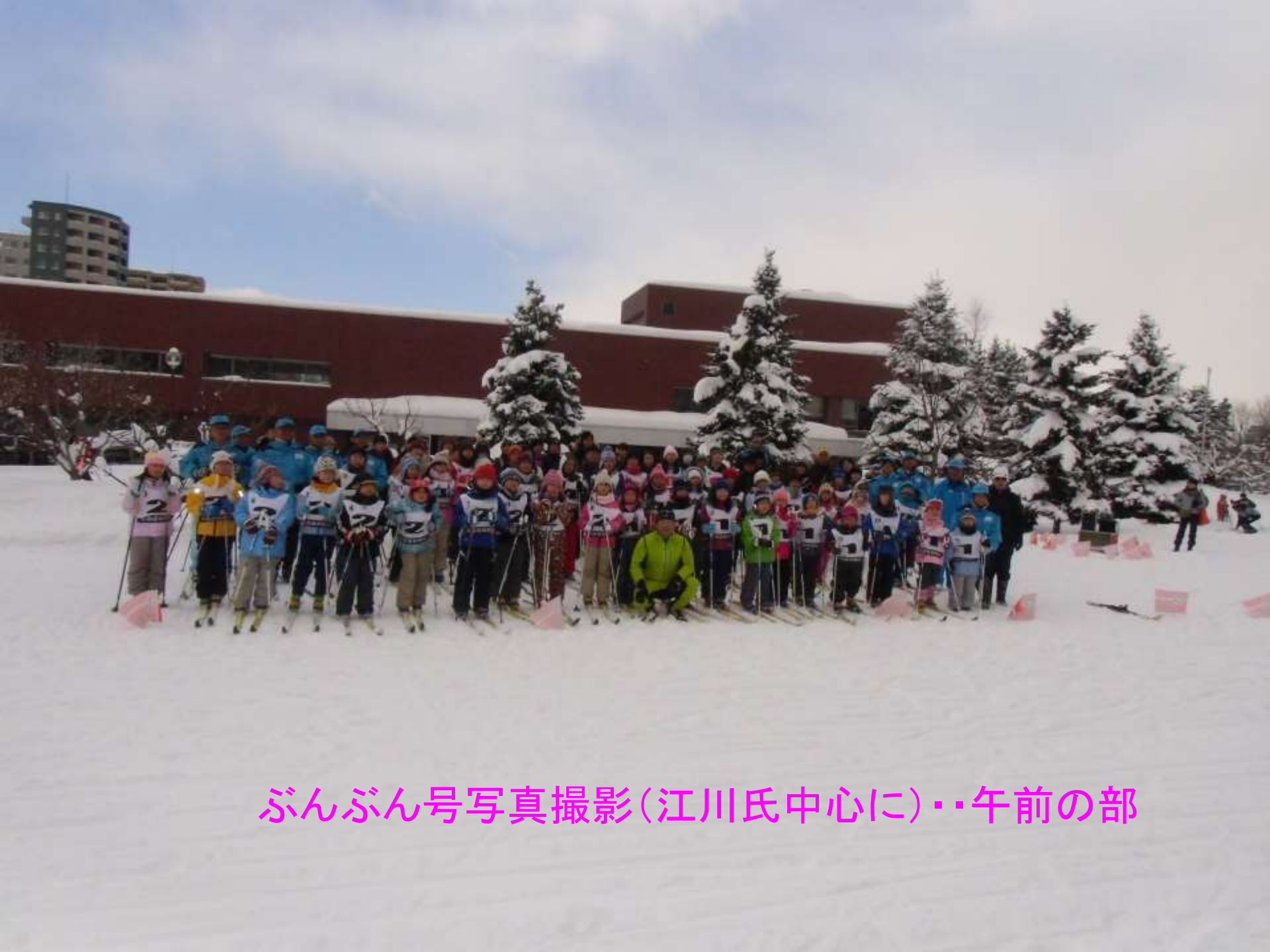
ぶんぶん号写真撮影(江川氏中心に)・・午前の部