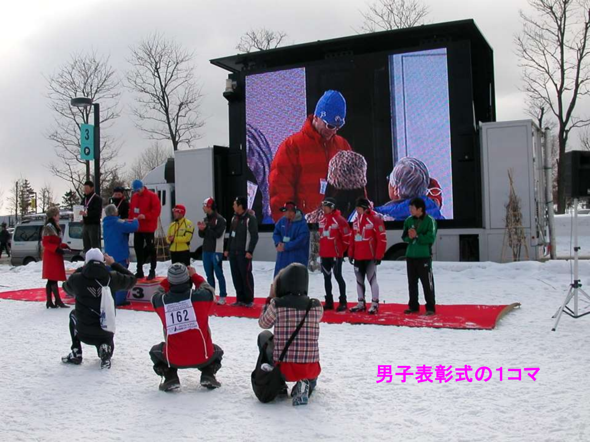
男子表彰式の1コマ