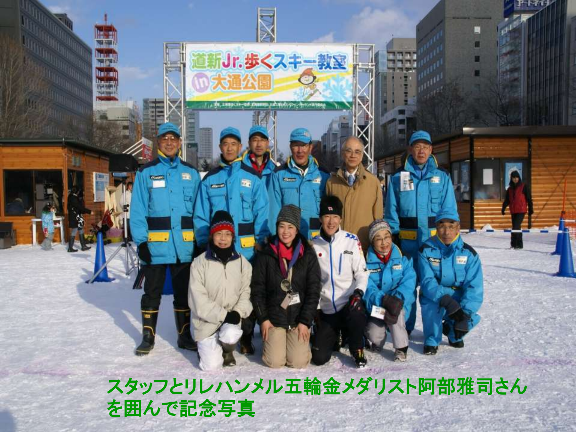
スタッフとリレハンメル五輪金メダリスト阿部雅司さんを囲んで記念写真