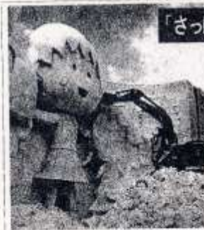
今年の雪まつり終了後に取り壊された雪像。来年は一部を再利用しスキーコースができる