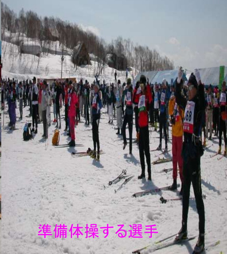
準備体操する選手