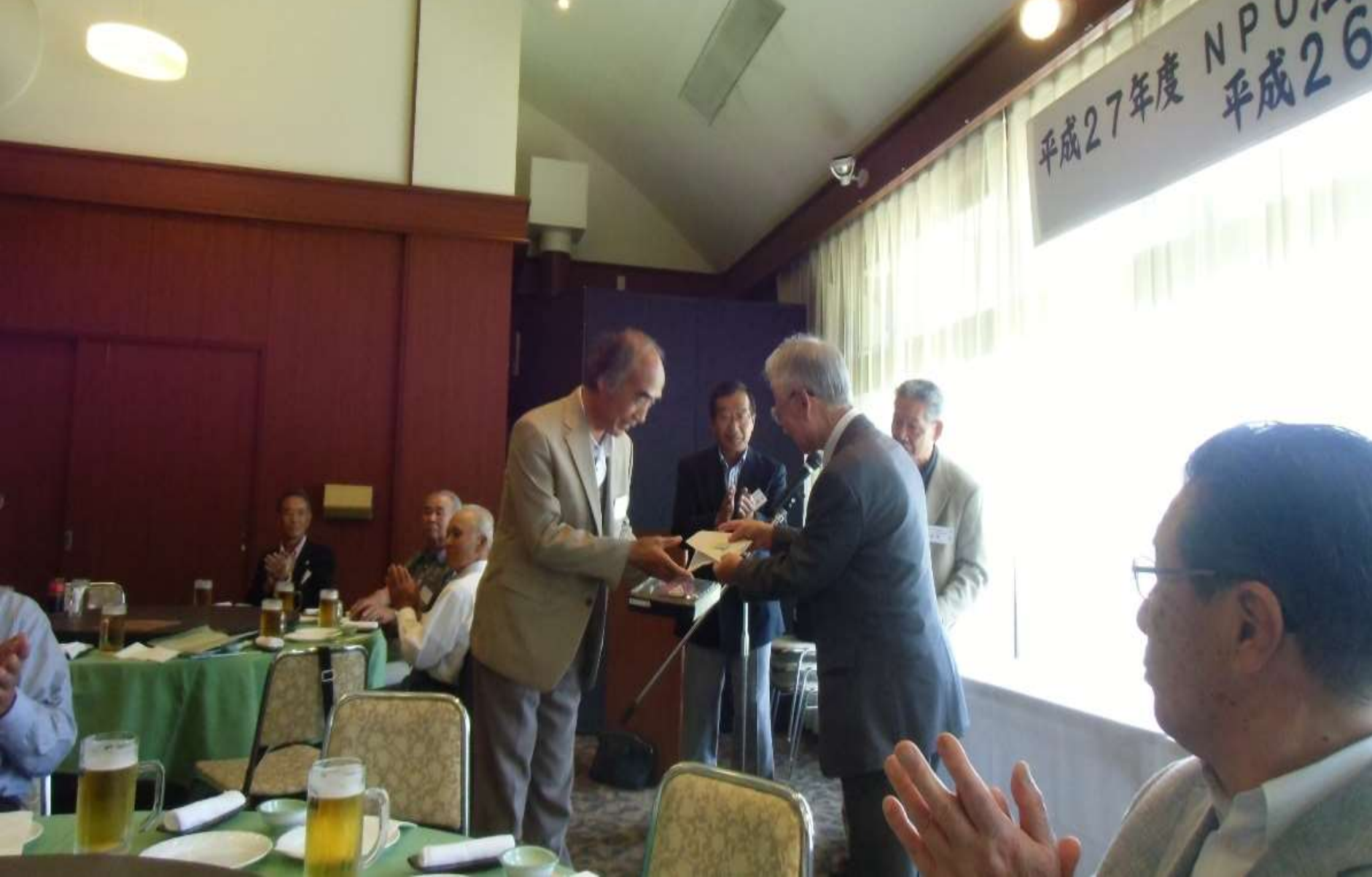
懇親会及び距離認定表彰式