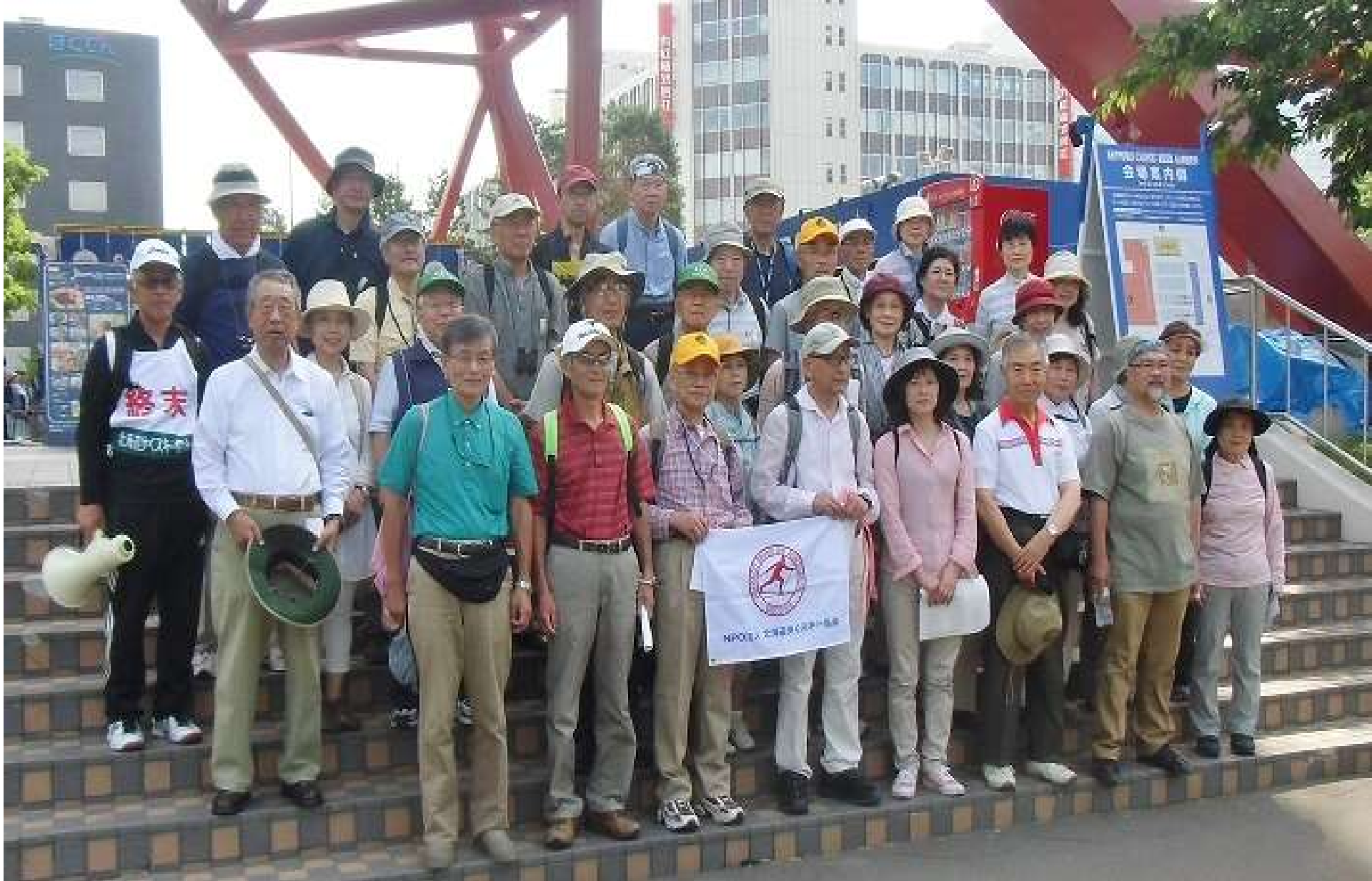
参加者30名でテレビ塔下で撮影