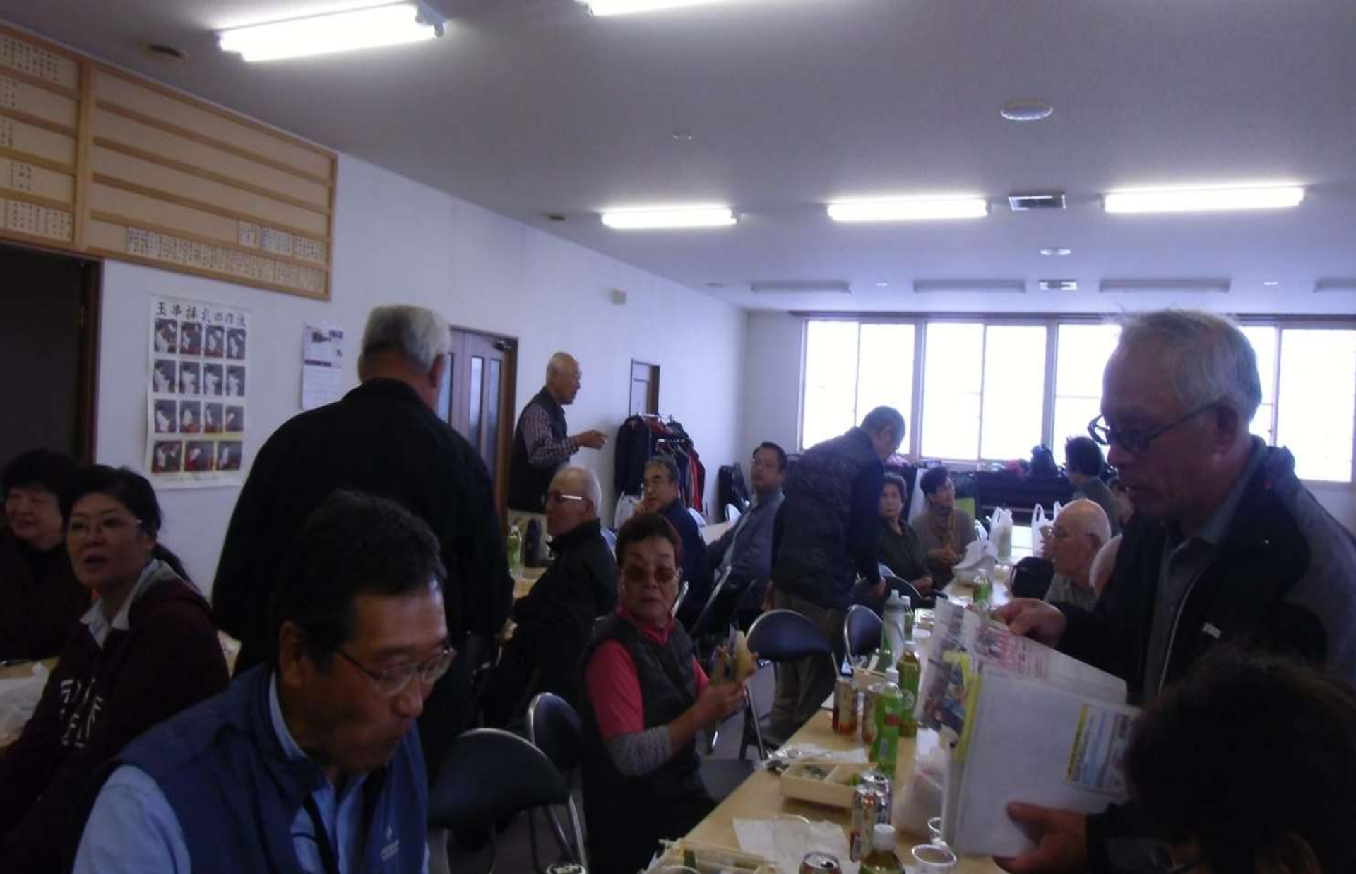
昼食会・お神酒で懇親の様子