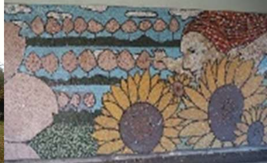
途中トンネル内のモザイクアート