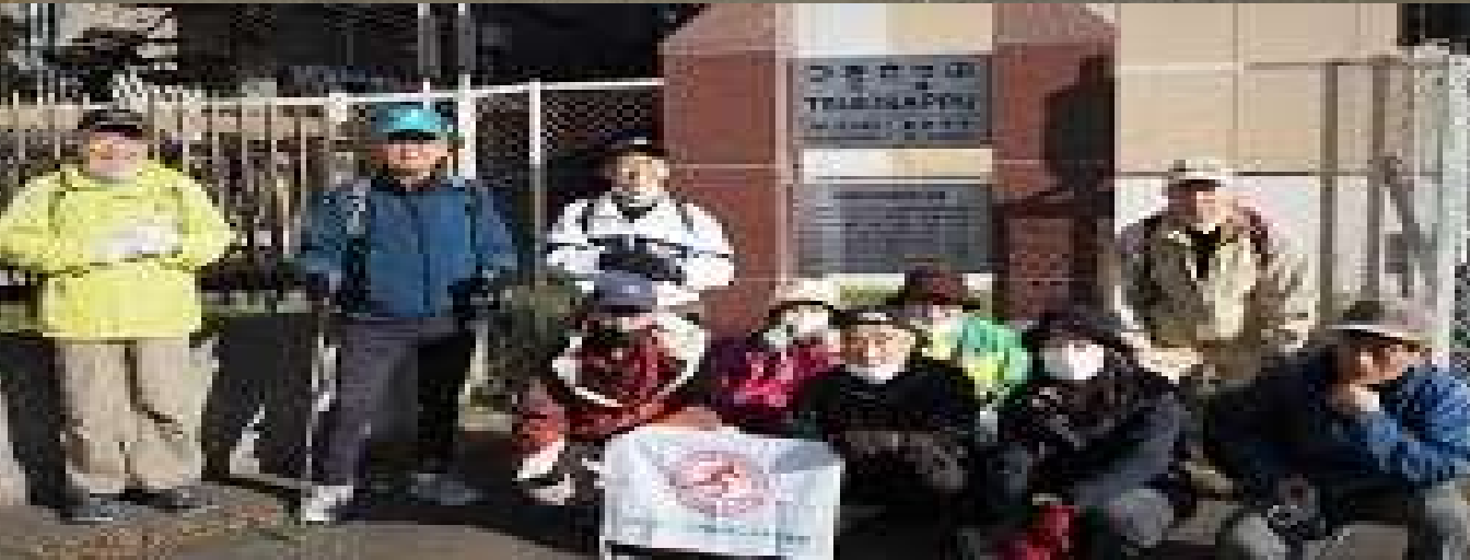
旧月寒駅跡にて 全員で集合写真