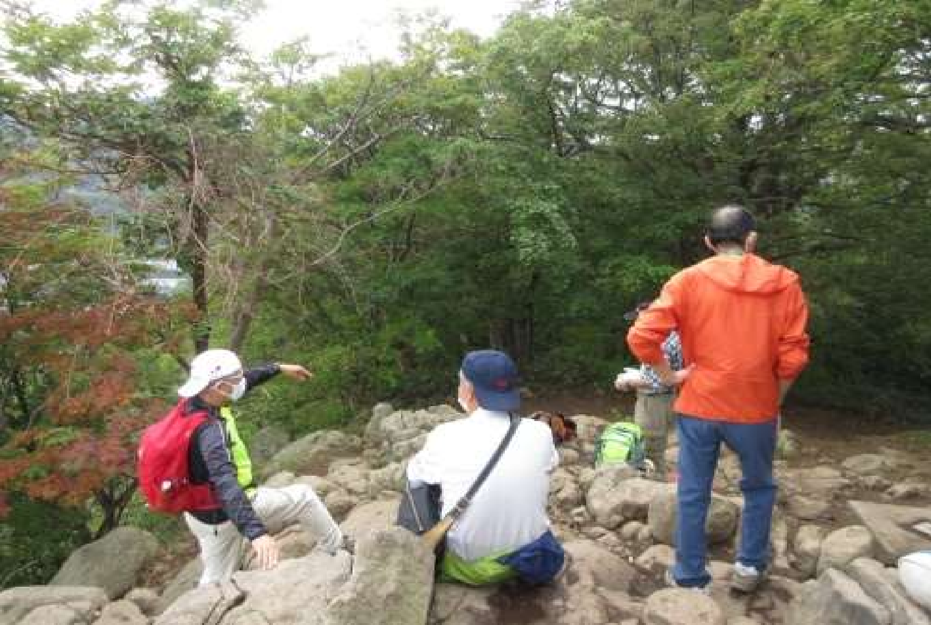
頂上でくつろぐ一行