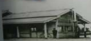
大正15年に開業した当時の木造駅舎

北海道鉄道株式会社により、沼の端から苗穂間札幌線の鉄道建設は、8年かけて大正15年（1926）8月に完成。同日21日、大谷地駅は貨物駅として開業した。この鉄道沿線の胆沢・十勝・石狩は、木材・銅・クロム鉱など資源が豊富な地域で、資源の開発の便を期した鉄道であった。 千歳には海軍飛行場があり、戦時下における陸上交通網の整備と強化のために私鉄の買収が行われ、昭和18年（1943）9月1日、国鉄千歳線大谷地駅となり一般駅となった。 昭和48年（1973）9月9日、新しい路線が開通したことで路線が変更になり、大谷地駅は廃止された。