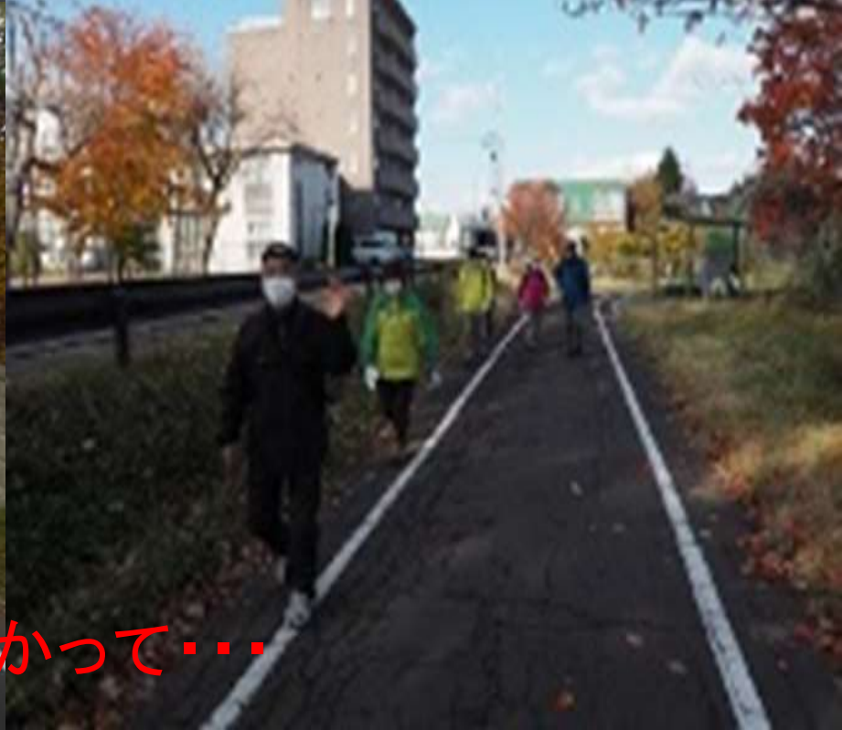
目的地に向かって・・・