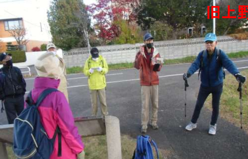
旧上野幌駅跡で休憩・・・