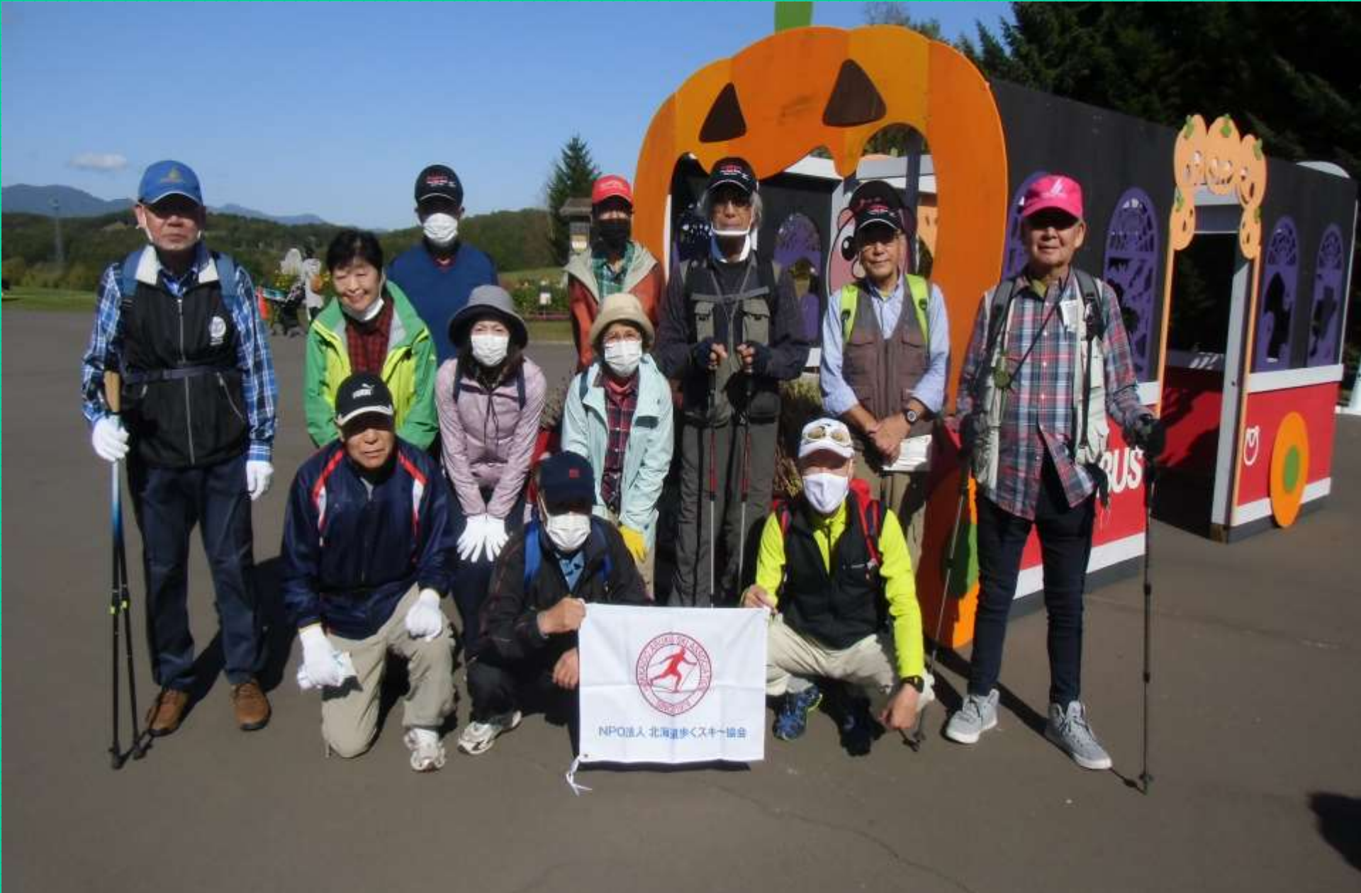
出発前の集合写真(AM9:45)