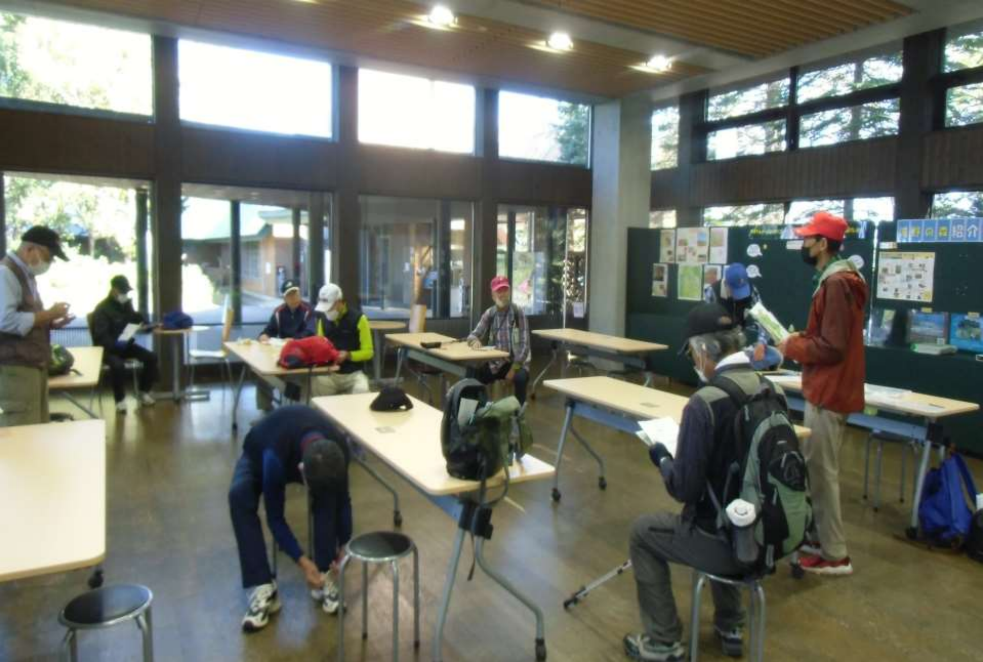
出発前のミーティング