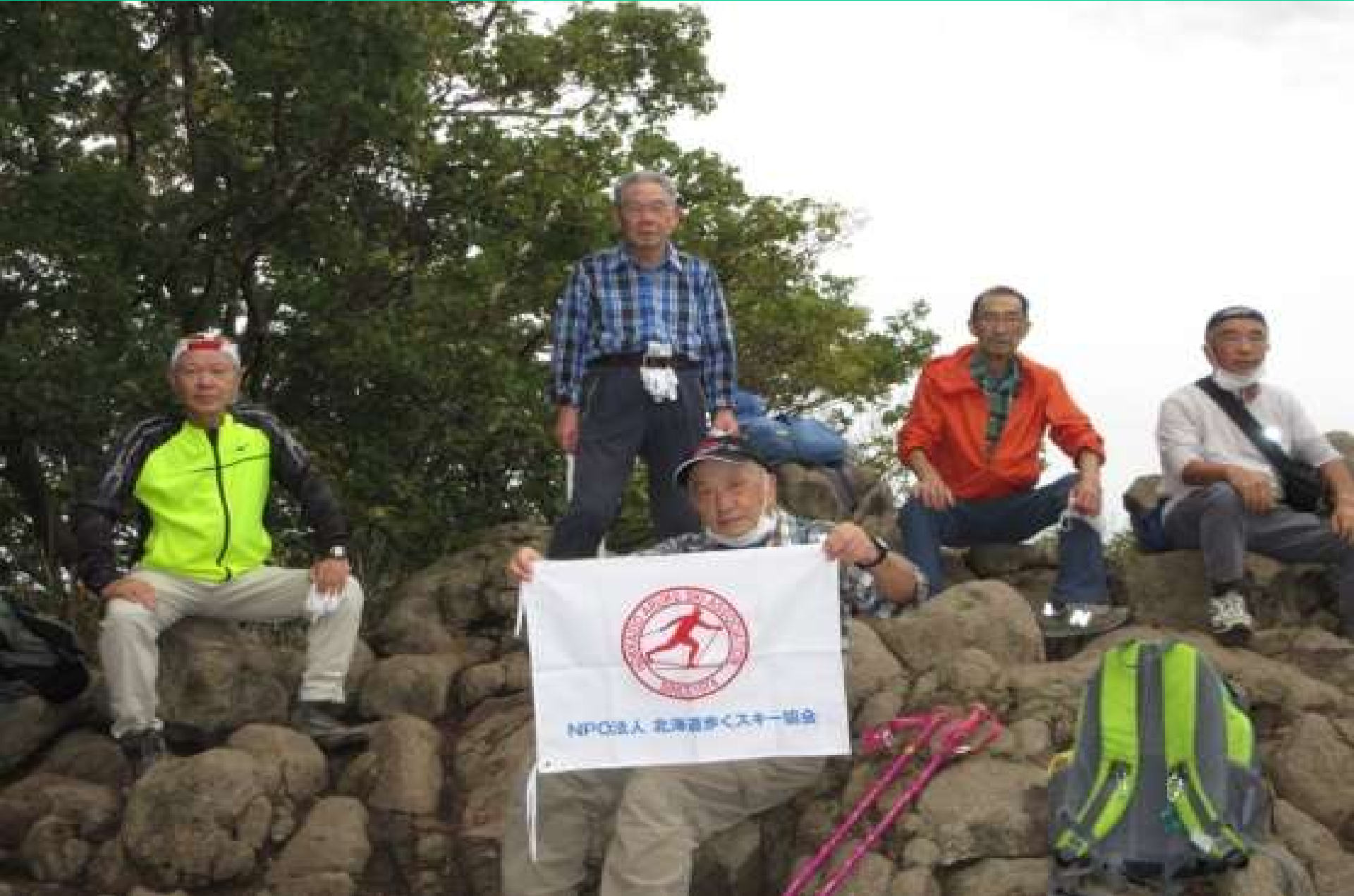
円山(標高225m)頂上での集合写真