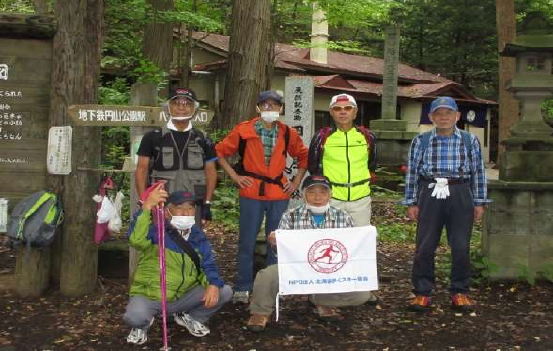
円山登山口(円山大師堂)での集合写真